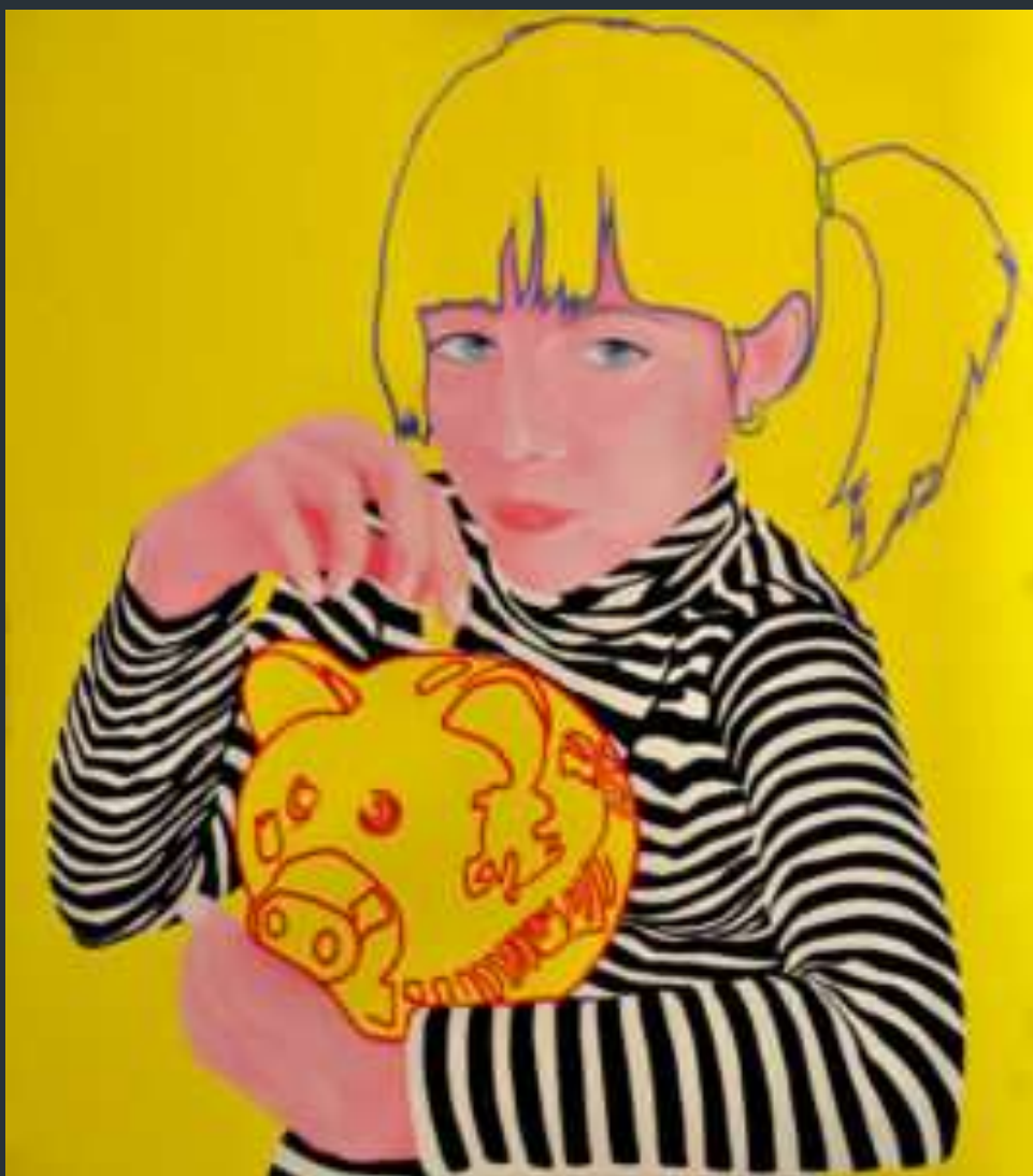
ΘΗΣΑΥΡΑΡΙΟΝ» του εικαστικού Νίκου Τσιαπάρα