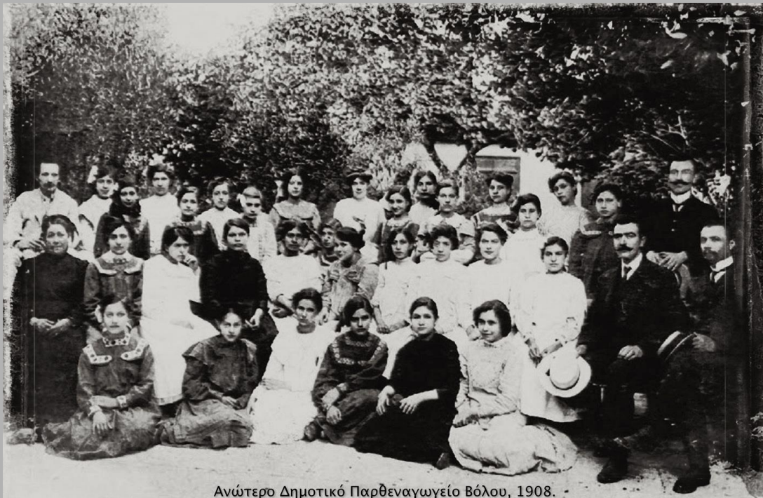
Ανώτερο Δημοτικό Παρθεναγωγείο Βόλου, 1908.