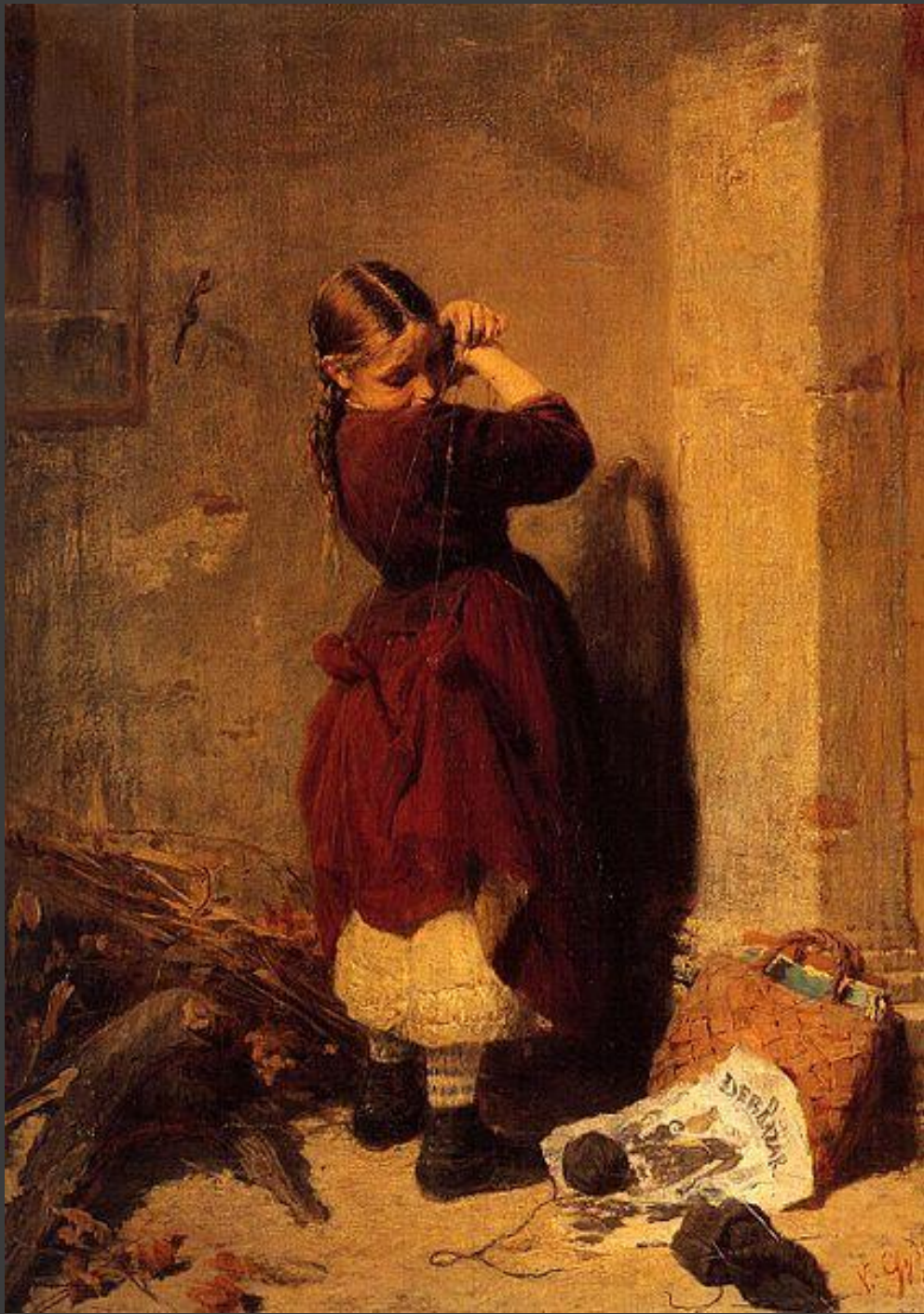
Κοριτσάκι που παίζει, 1868