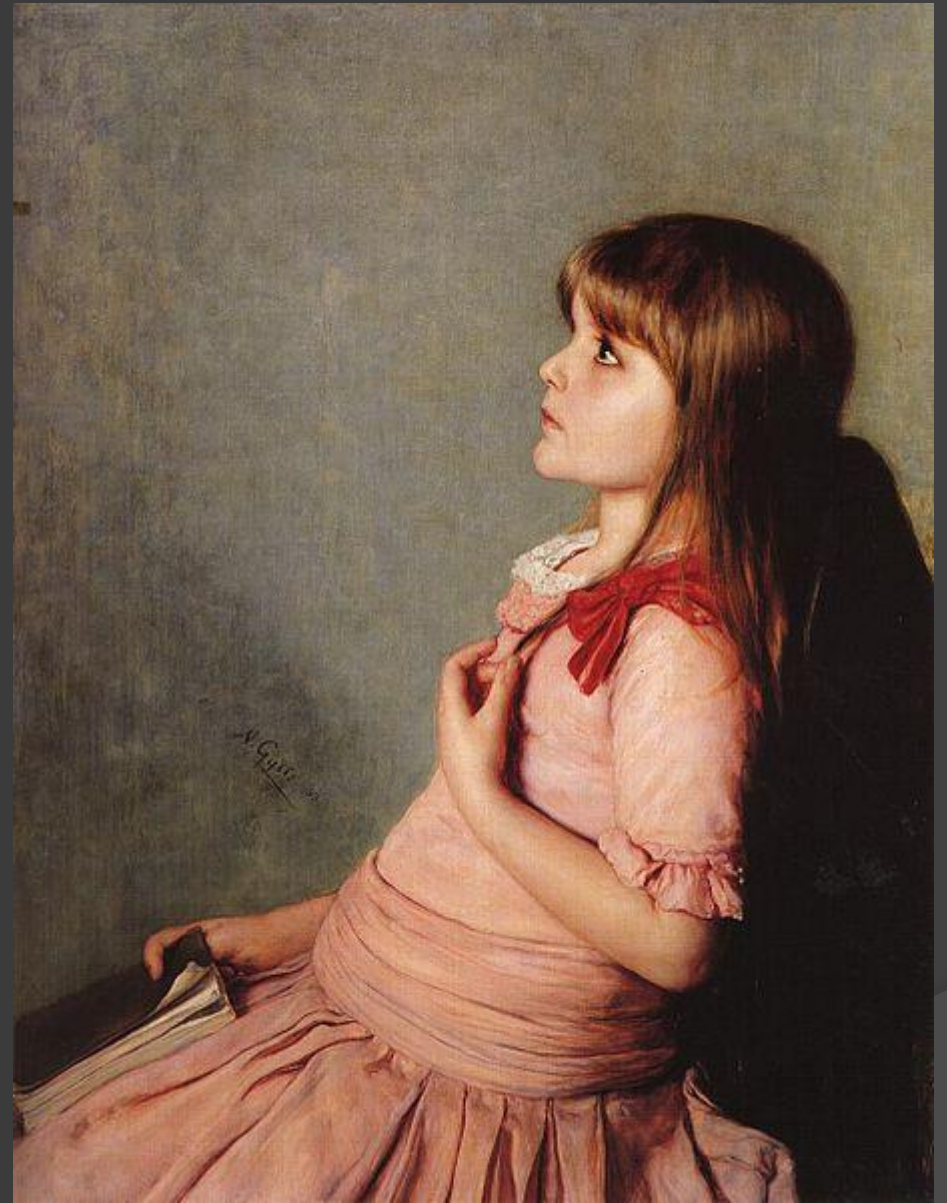
Η Αποστήθιση, 1883