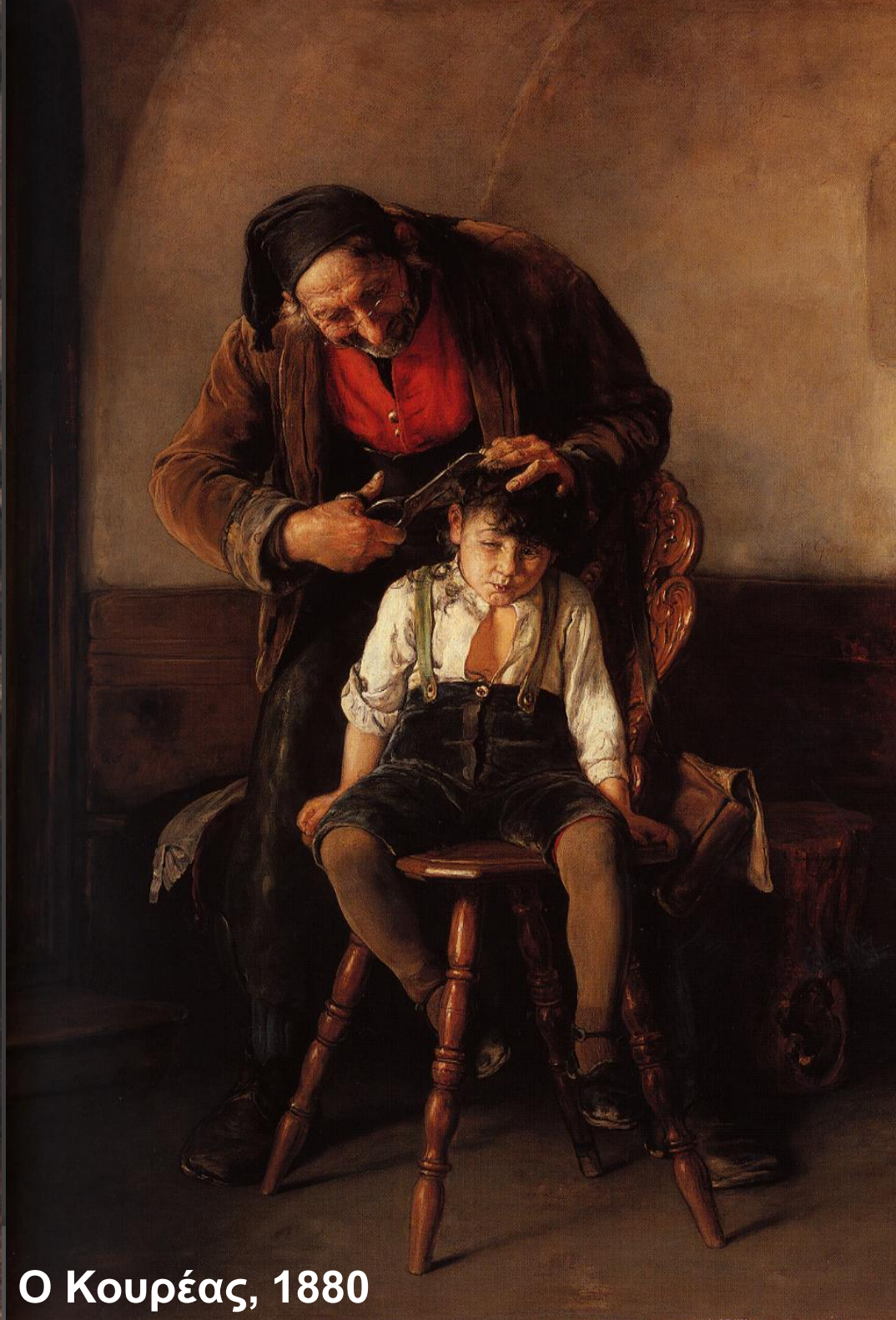
Ο Κουρέας, 1880