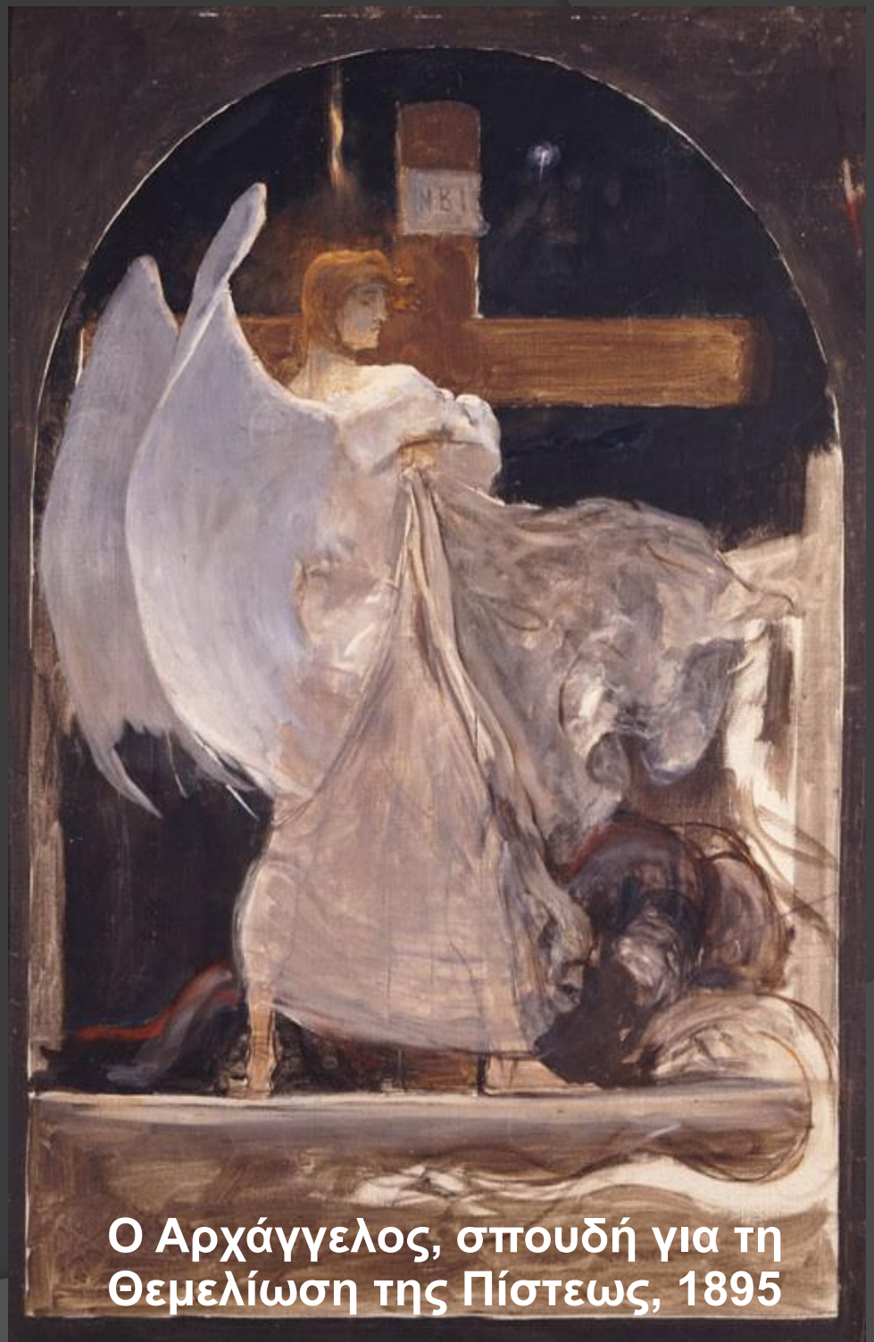
Ο Αρχάγγελος, σπουδή για τη Θεμελίωση της Πίστεως, 1895