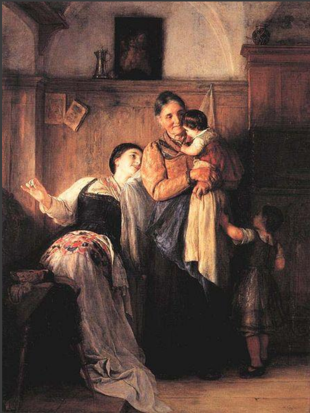
Kou – Kou, 1882