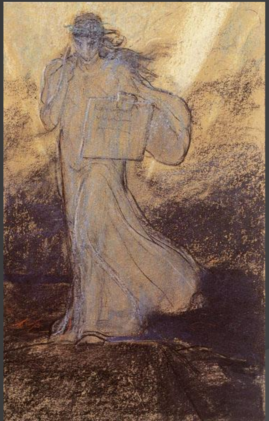
«Η Δόξα». Εθνική Πινακοθήκη.