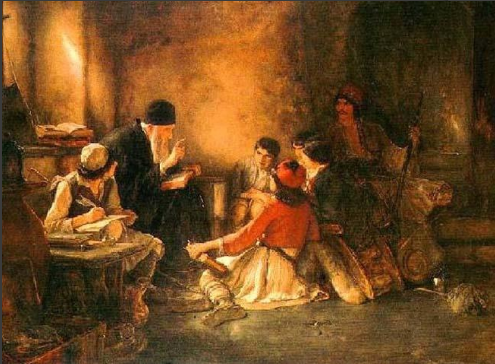
Το κρυφό σχολειό (1885)