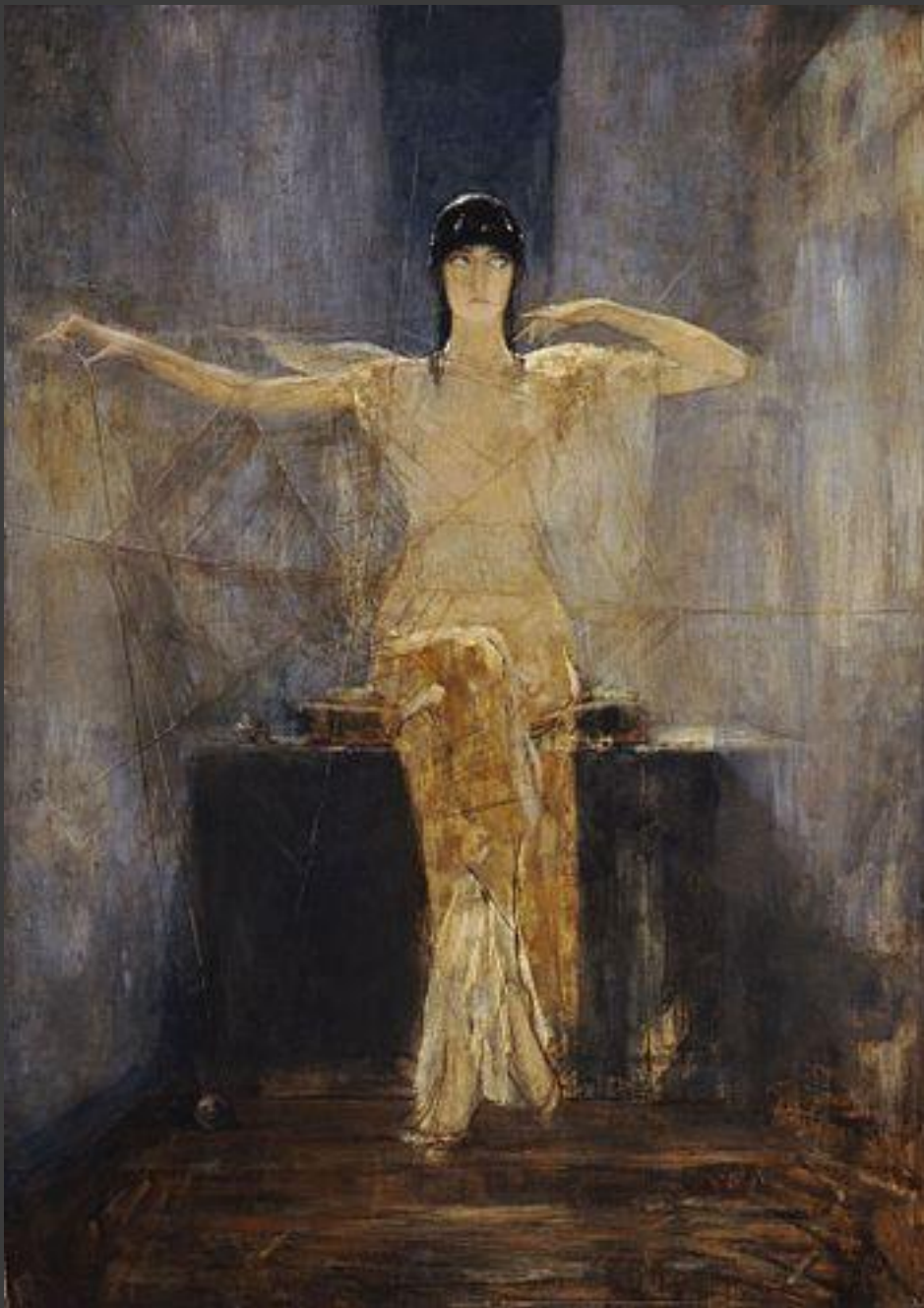
Η Αράχνη, 1884