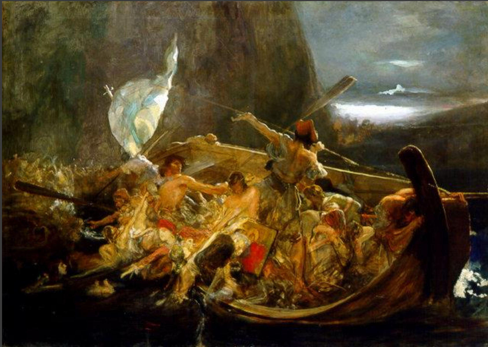
Μετά την Πτώση των Ψαρών