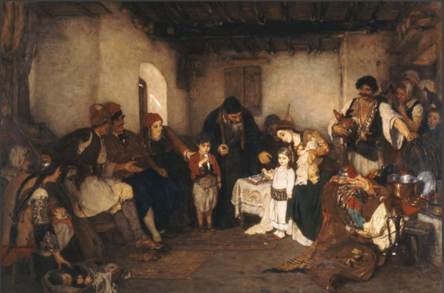
Τα αρραβωνιάσματα (1875)