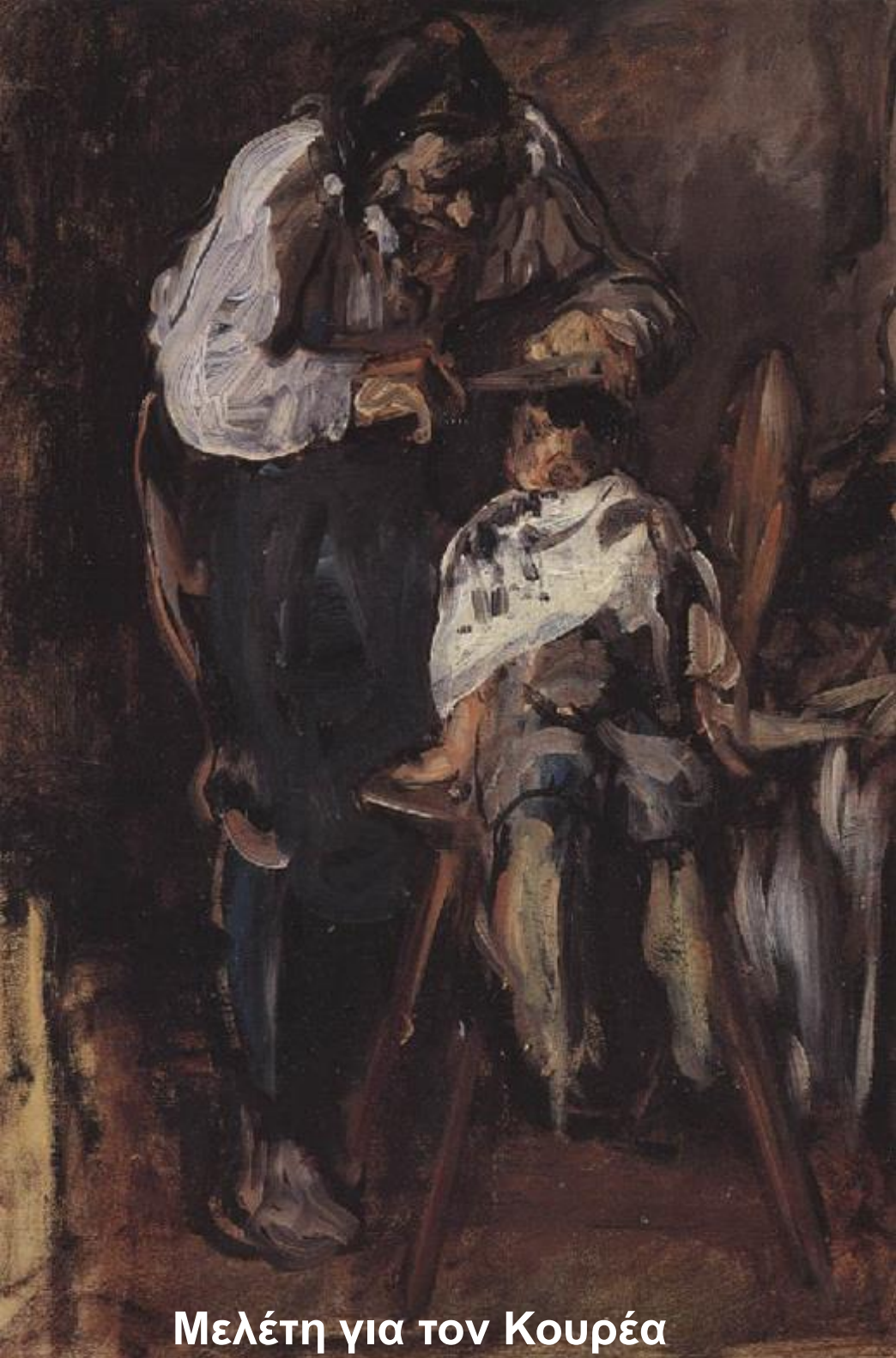
Μελέτη για τον Κουρέα