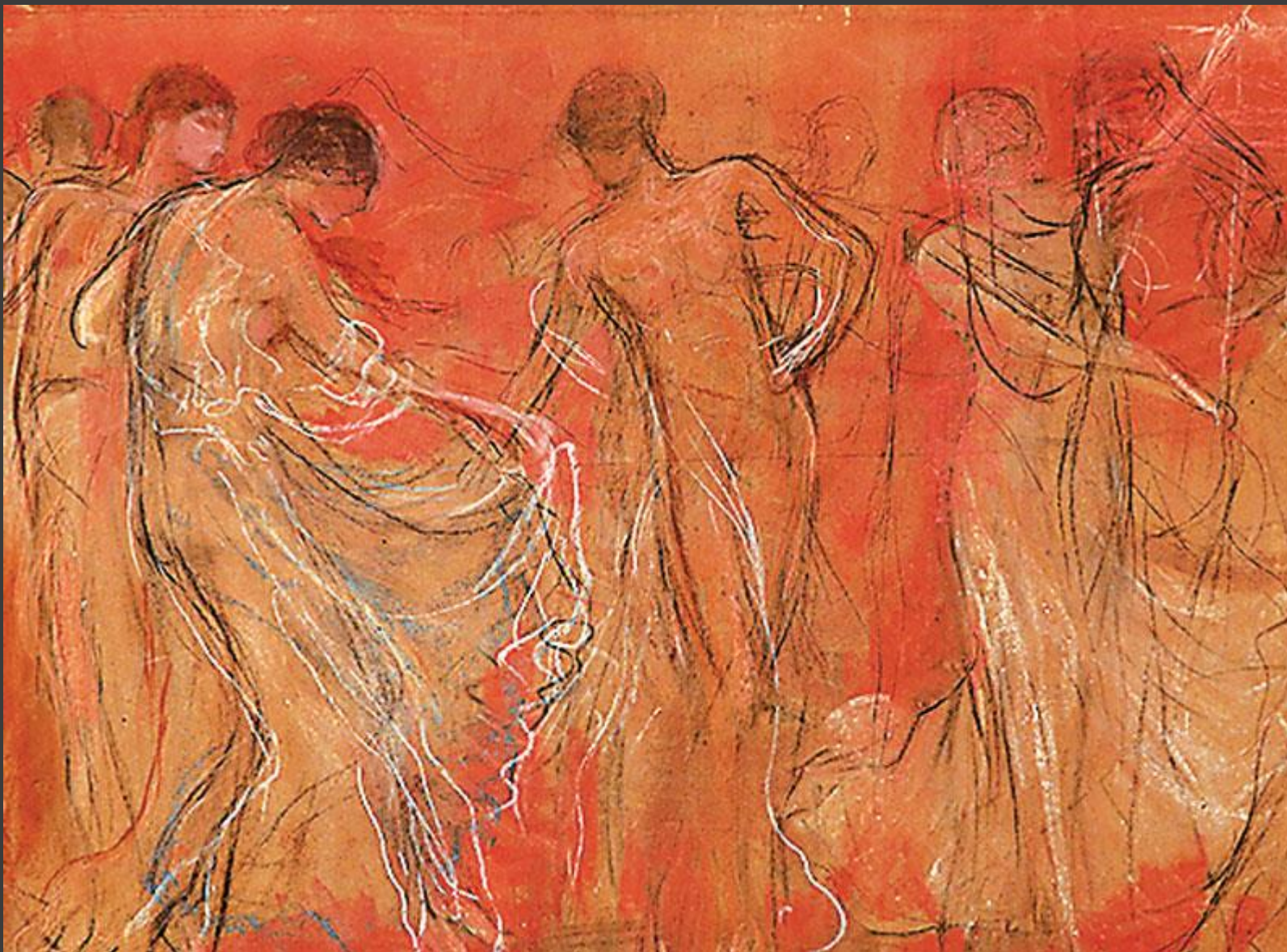
Ο χορός των Μουσών