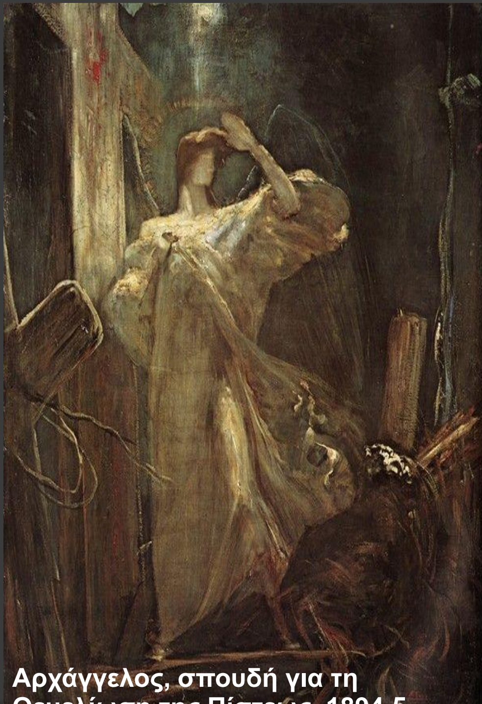
Αρχάγγελος, σπουδή για τη Θεμελίωση της Πίστεως, 1894-5