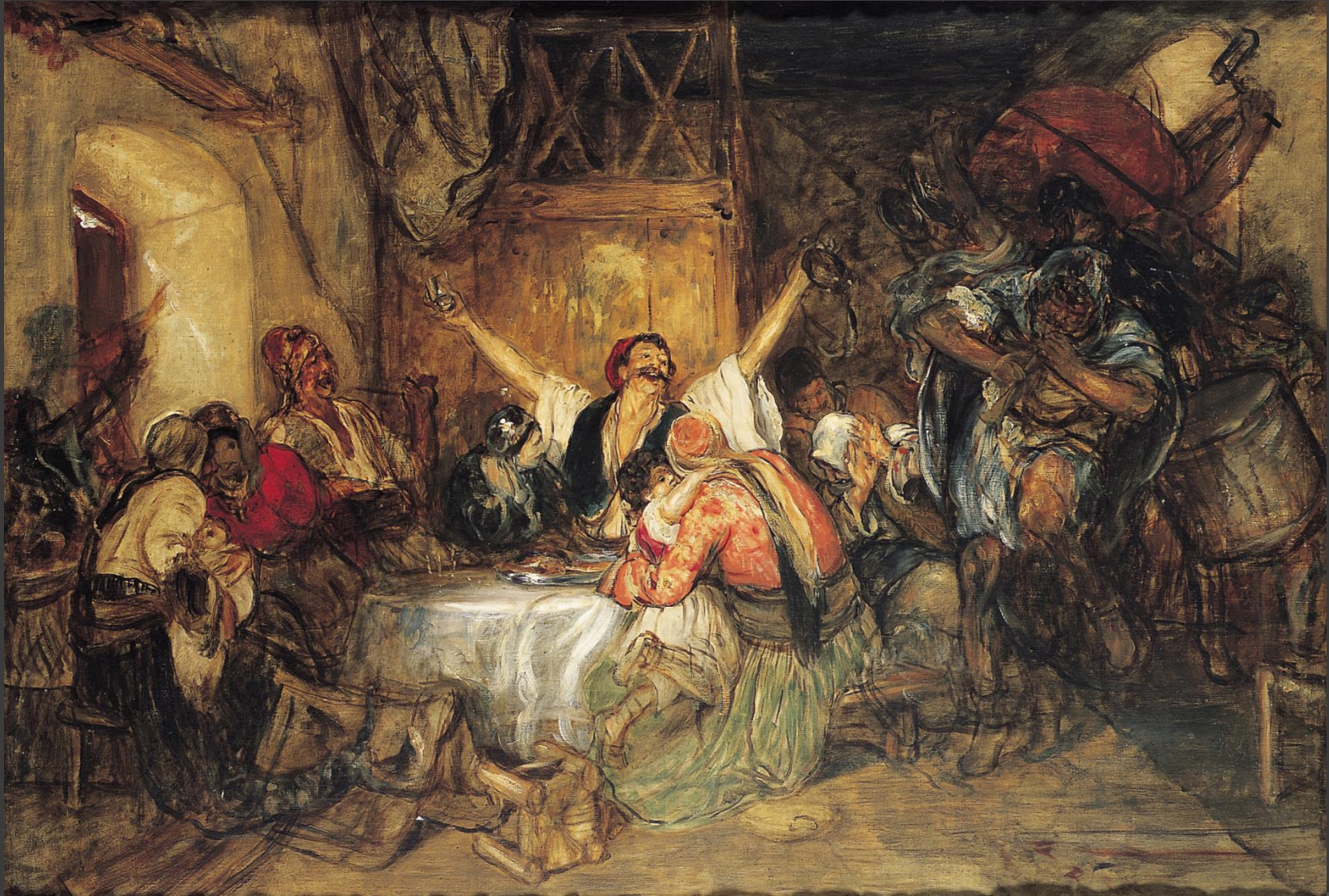
Αποκριά στην Αθήνα, 1892