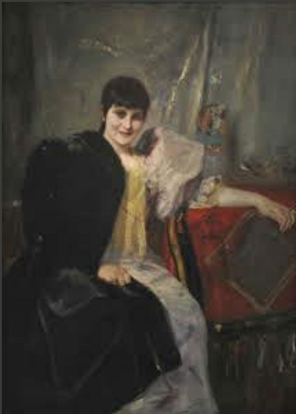
Προσωπογραφία της Άρτεμης Γύζη, 1890