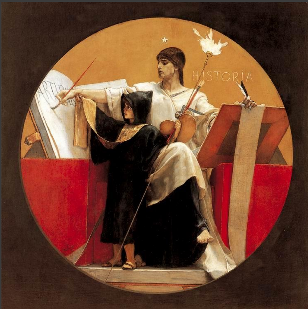
Η Ιστορία, 1892