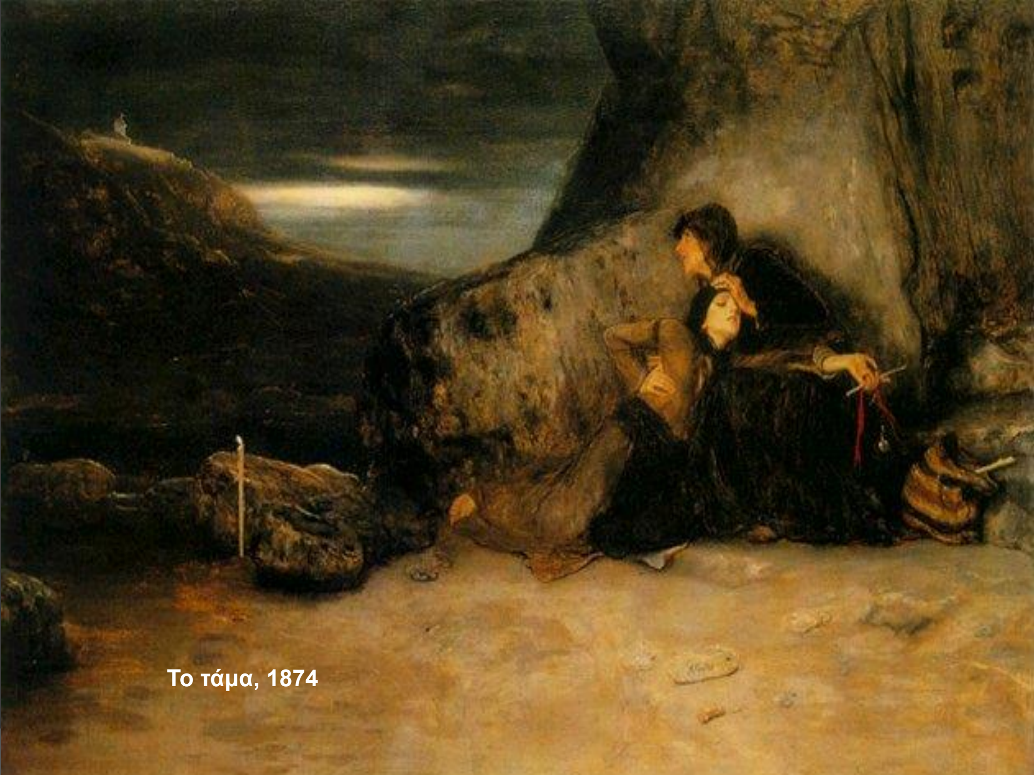
Το τάμα, 1874