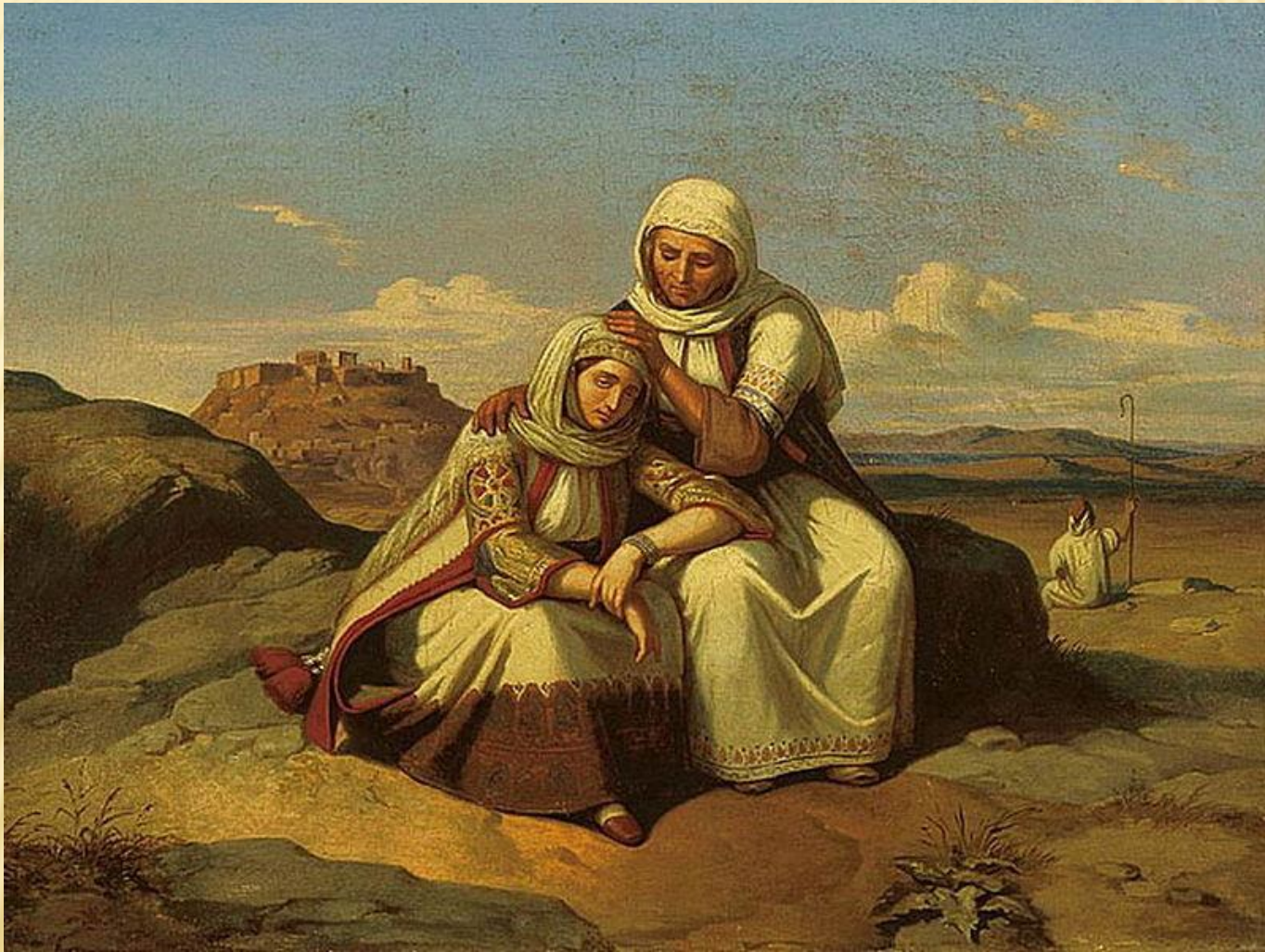
«Η παραμυθία» 1847, Αθήνα, Εθνική Πινακοθήκη