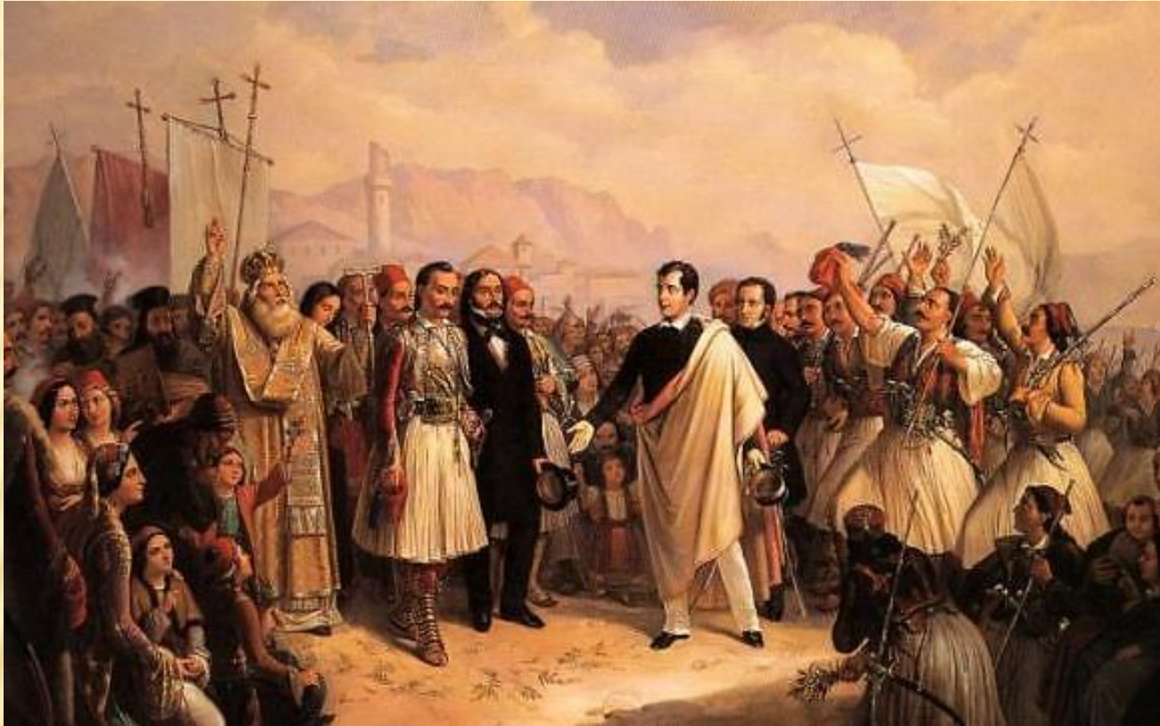
«Η υποδοχή του λόρδου Βύρωνα στο Μεσολόγγι» 1861, Αθήνα, Εθνική Πινακοθήκη