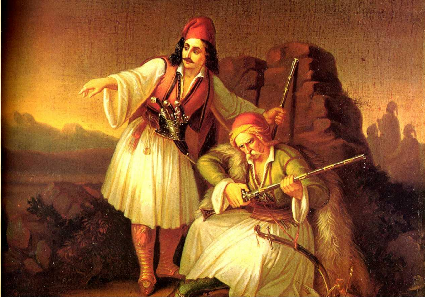
«Δύο πολεμιστές ή καραούλι» 1855