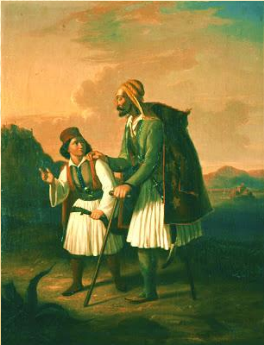
«Τυφλός τραυματίας» 1850, Αθήνα, Εθνική Πινακοθήκη