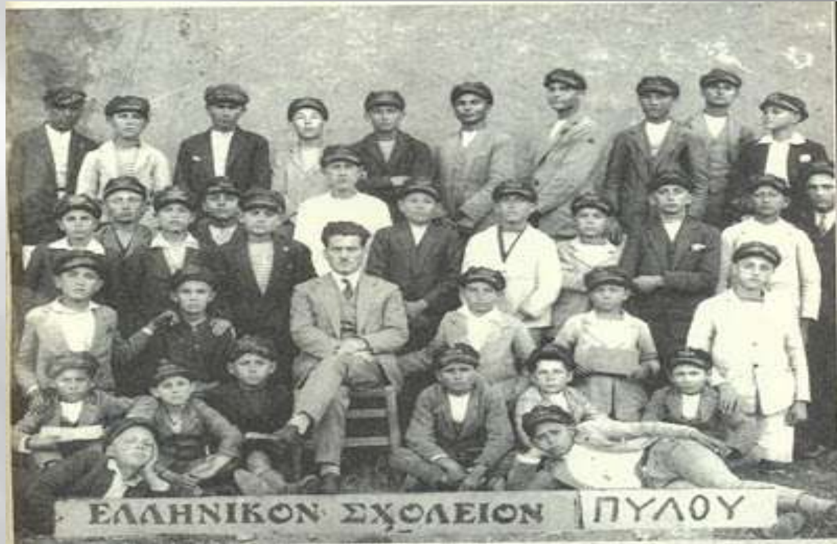
Υποχρεωτική η τραγιάσκα για τα αγόρια (Ελληνικό Σχολείο Αρρένων Πύλου, 1930)