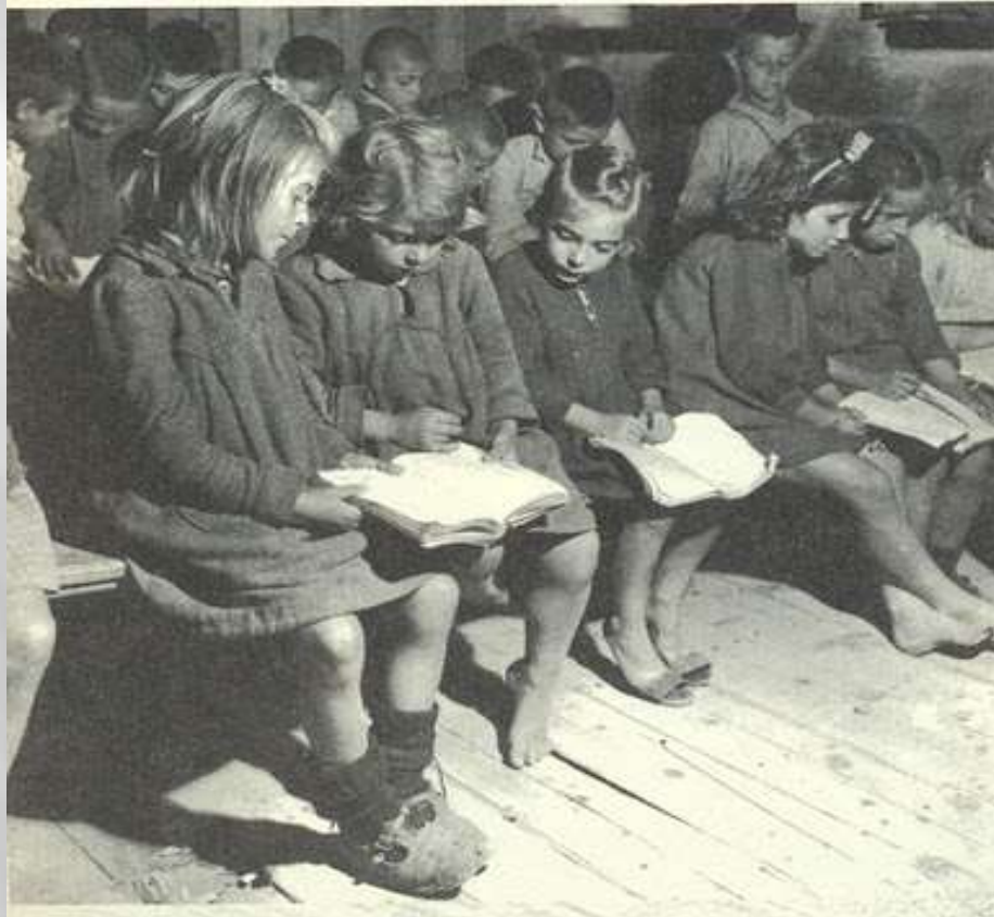
Δημοτικό σχολείο Καναλίων Βόλου, 1949