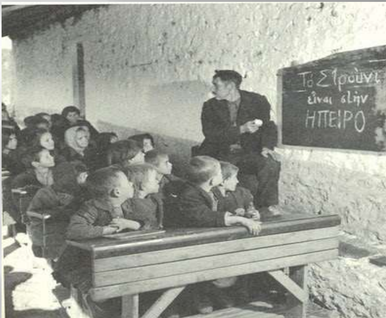
Δημοτικό σχολείο στην Ήπειρο, 1950