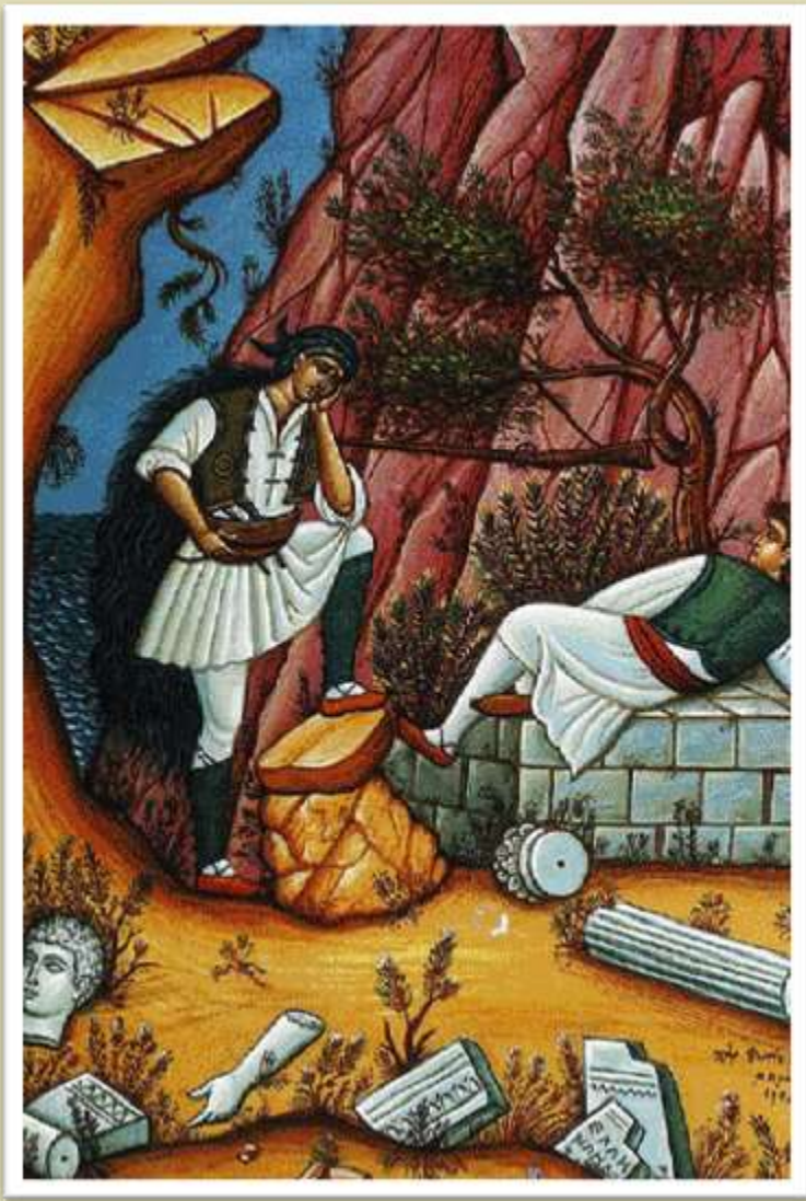
«Αρματολοί και Κλέφτες», Φώτης Κόντογλου 1948