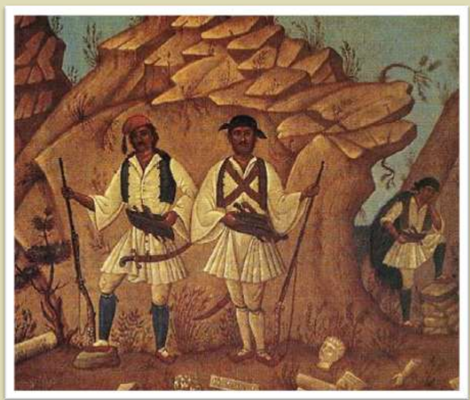
«Αρματολοί και Κλέφτες» Φώτης Κόντογλου