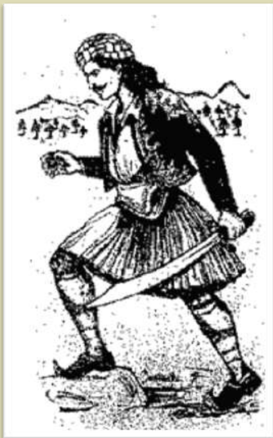
Ο θρυλικός κλέφτης Κατσαντώνης.