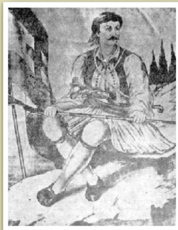
Ο Ζαχαριάς ήταν φημισμένος κλέφτης και αρματολός της Πελοποννήσου και ένας από τους πρόδρομους του εθνικοαπελευθερωτικού αγώνα του 21