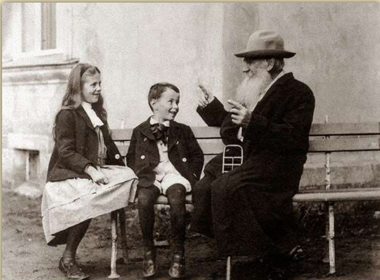
Ο Τολστόι με τα εγγόνια του