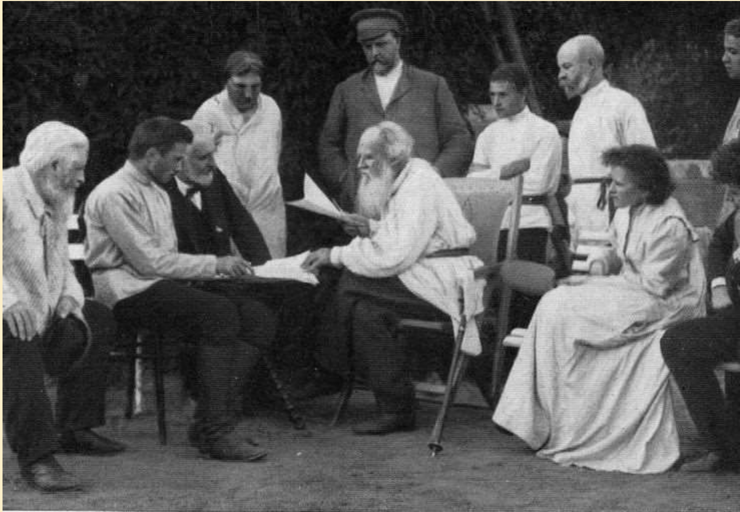
Ο Λέων Τολστόι διαβάζει γραπτά του σε φίλους 1910