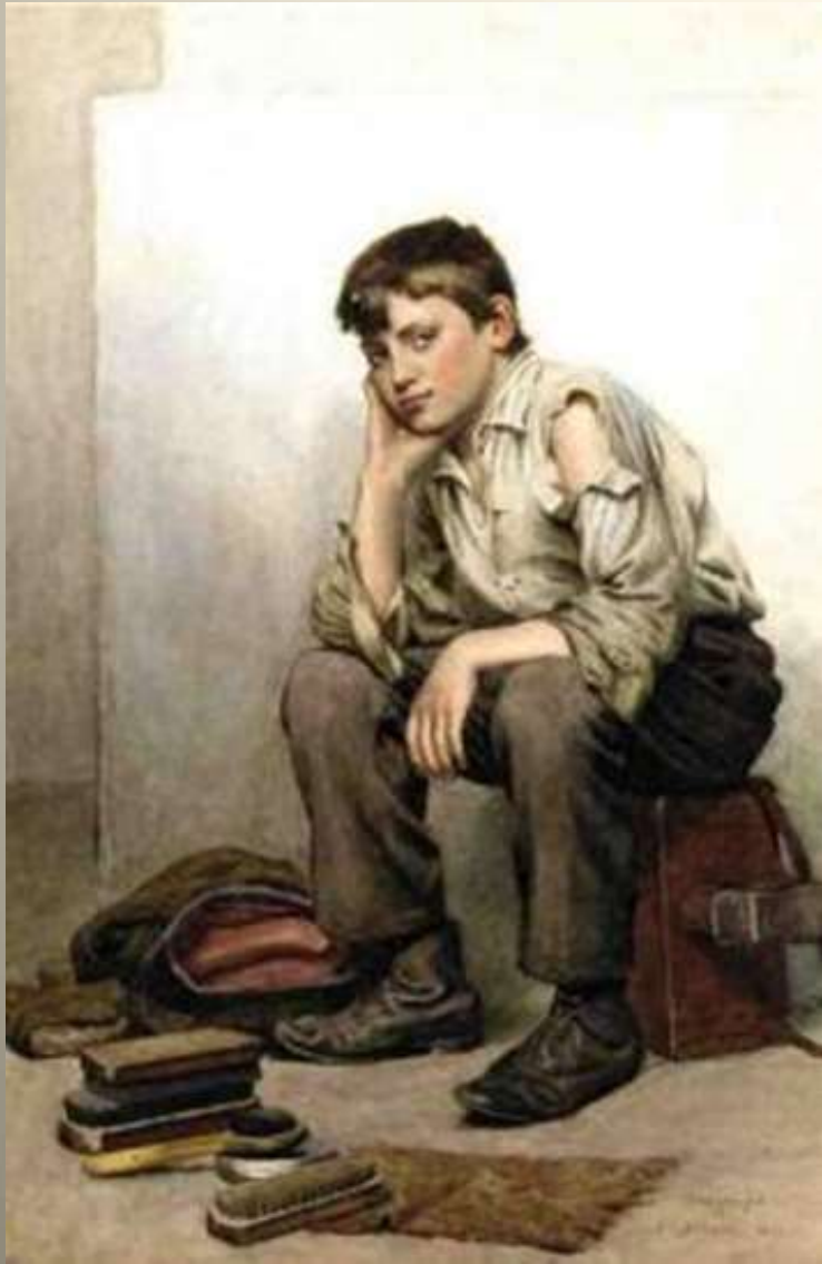
Ο λούστρος, J. George Brown