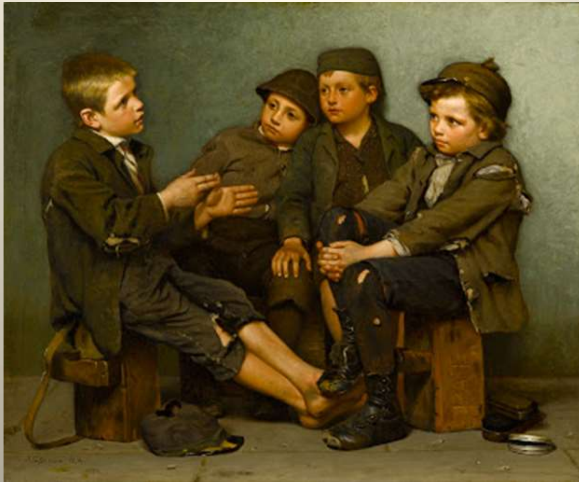
Μία σκληρή ιστορία, 1886 North Carolina Museum of Art J. George Brown