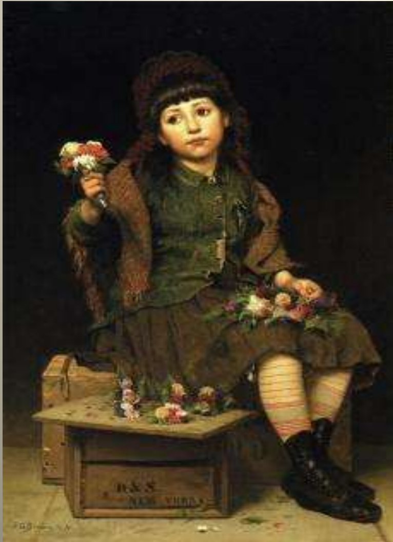
Αγόρασε ένα μπουκέτο, 1881 J. George Brown