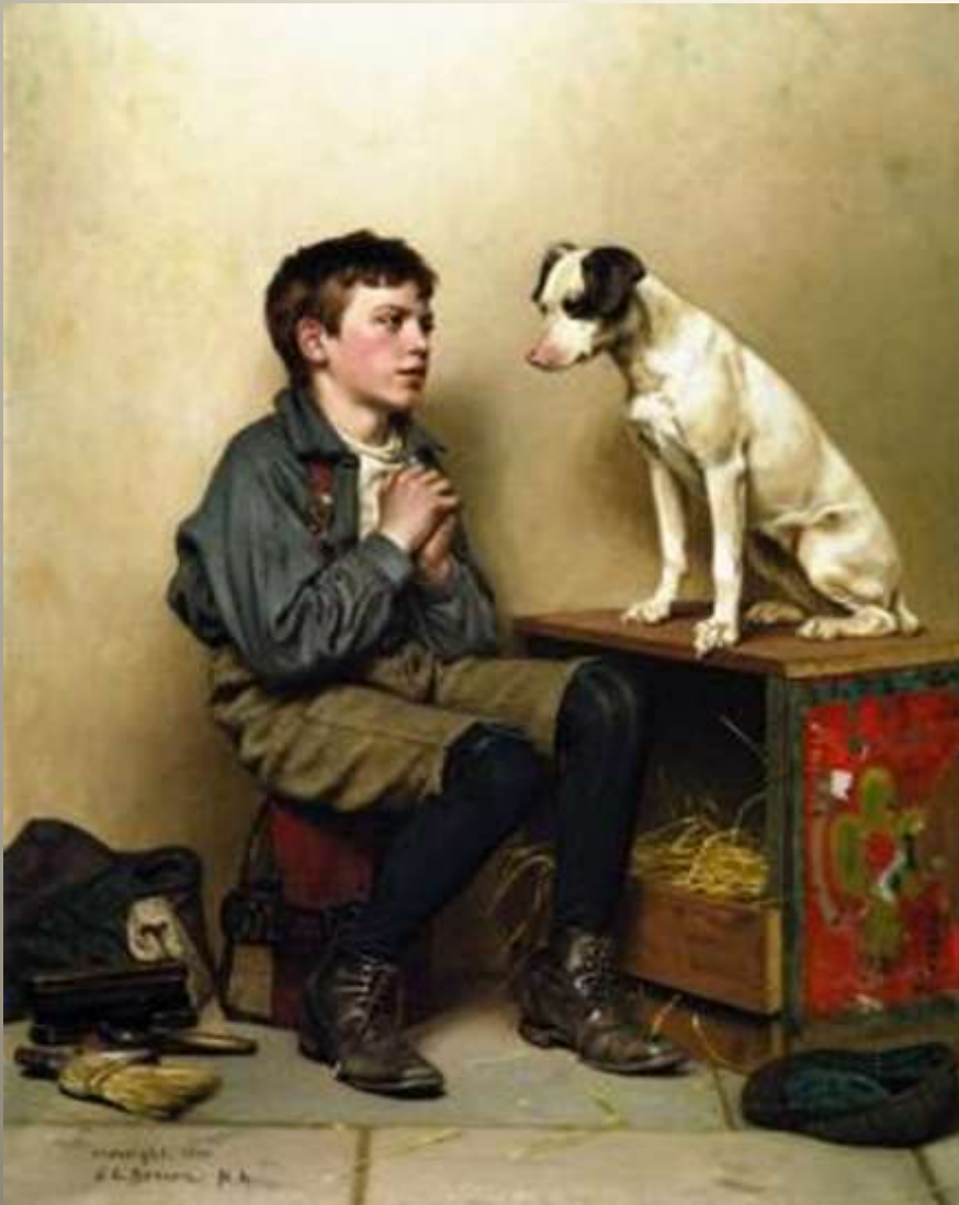
Λούστρος μ' ένα σκύλο, 1900 J. George Brown