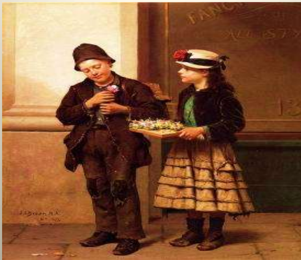
Το κορίτσι με τα λουλούδια, 1877 J. George Brown