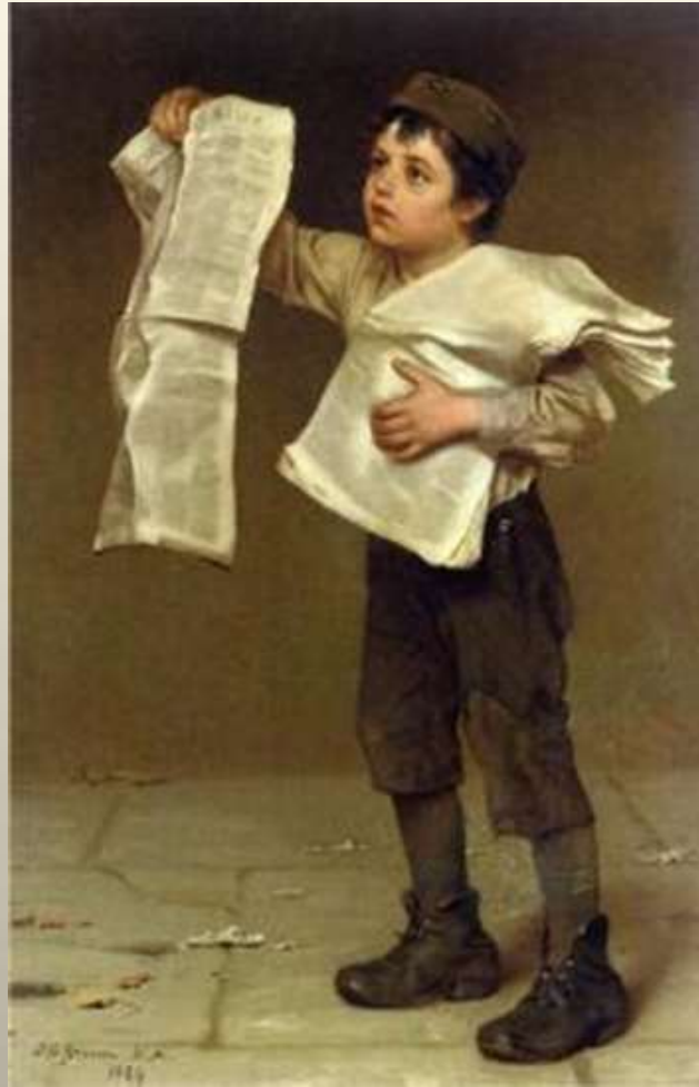
Αγόρι που πουλάει εφημερίδες, 1884 J. George Brown