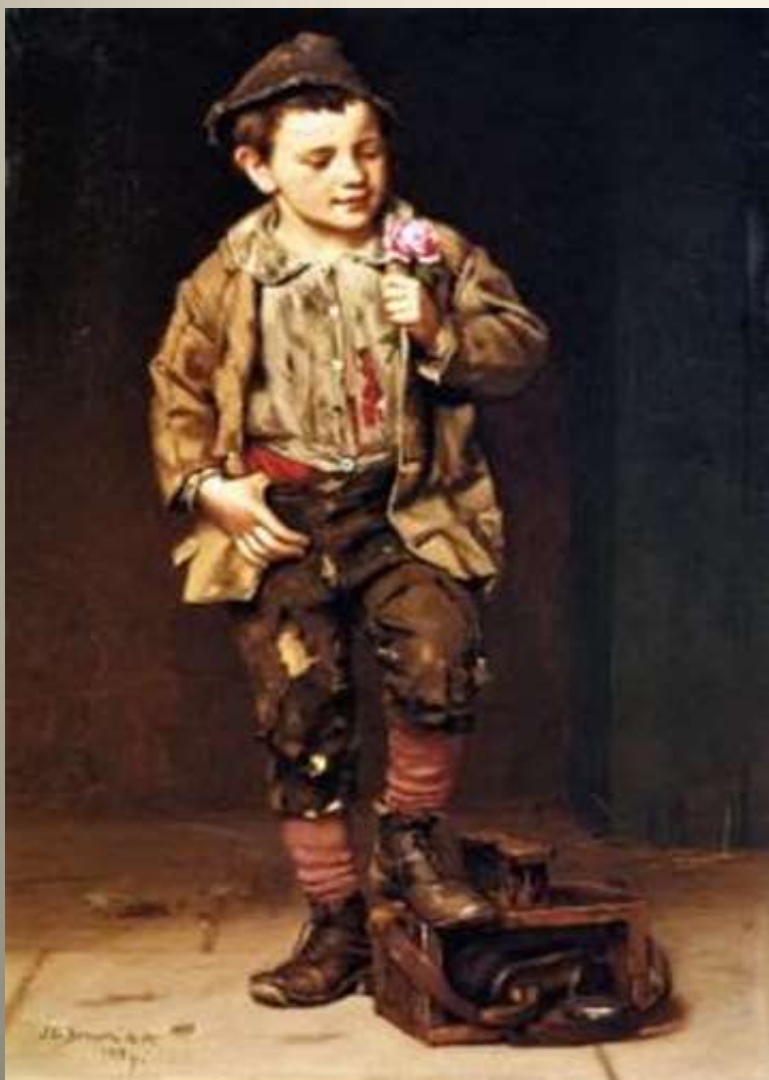
Ο λούστρος μ' ένα τριαντάφυλλο, 1884 J. George Brown