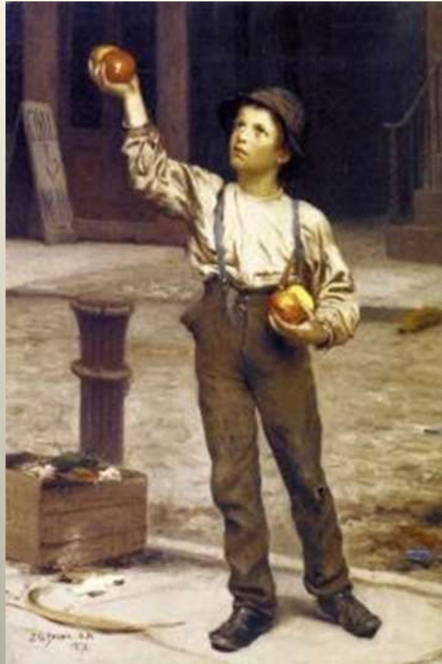
Ο πωλητής μήλων, 1878 J. George Brown