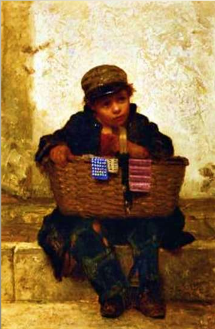
Ο πωλητής κουμπιών, 1865 J. George Brown