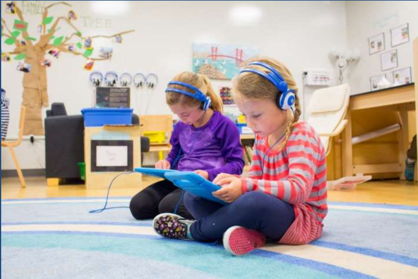
AltSchool. Σαν Φρανσίσκο, Καλιφόρνια. Το σχολείο της Silicon Valley.