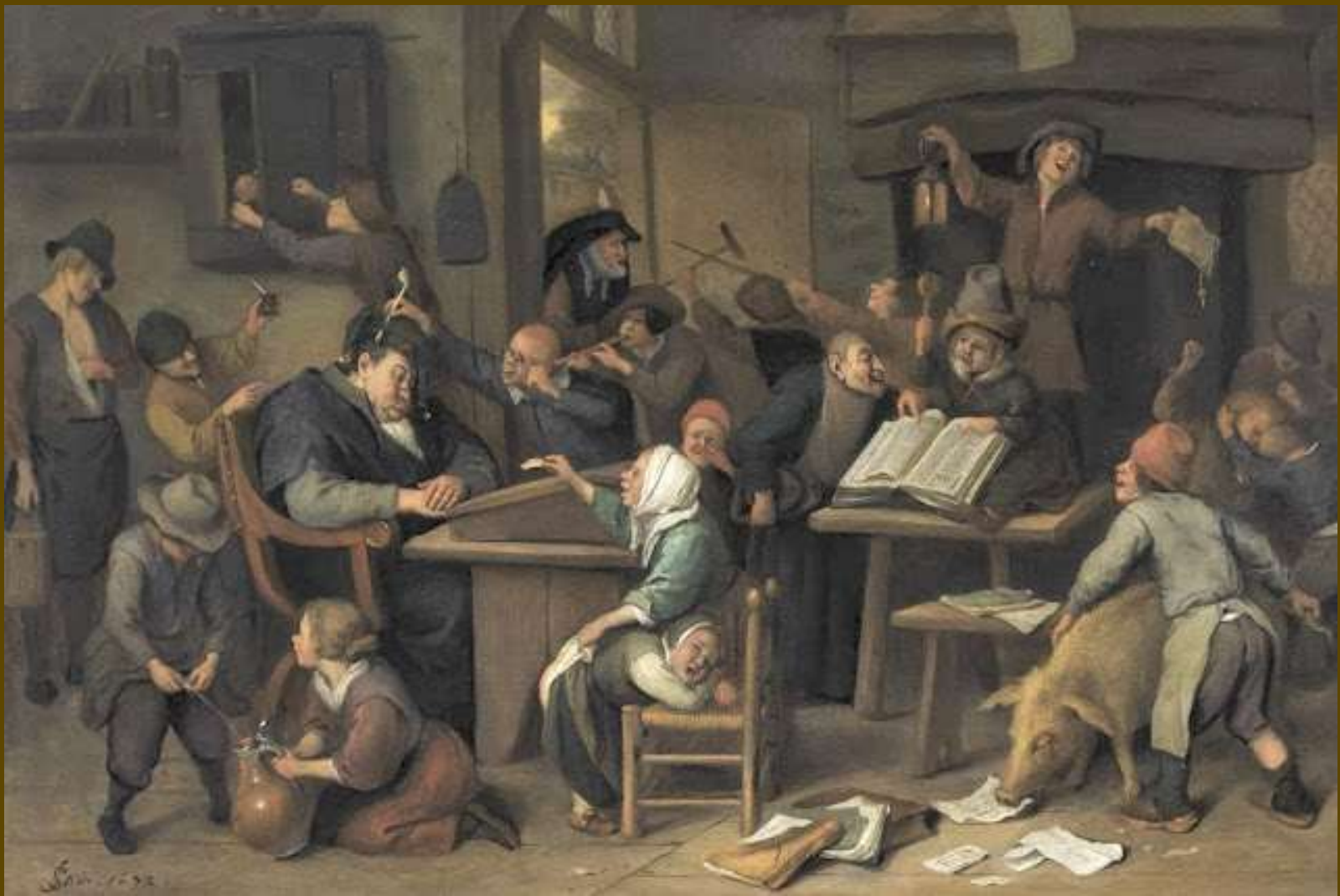
J. Steen, Τάξη σχολείου με δάσκαλο που κοιμάται, 1672.