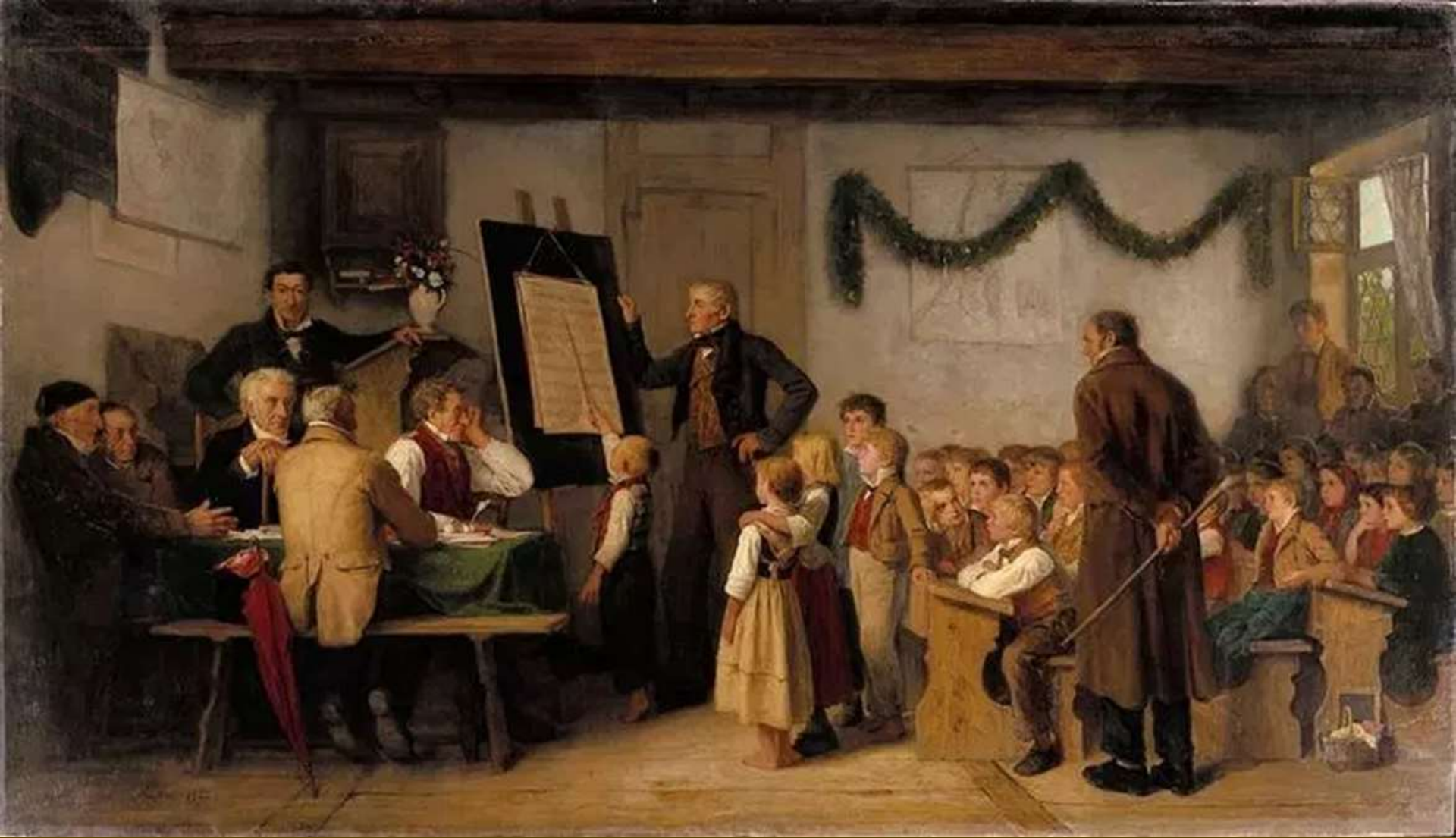
Σχολική εξέταση, Albert Anker 1862