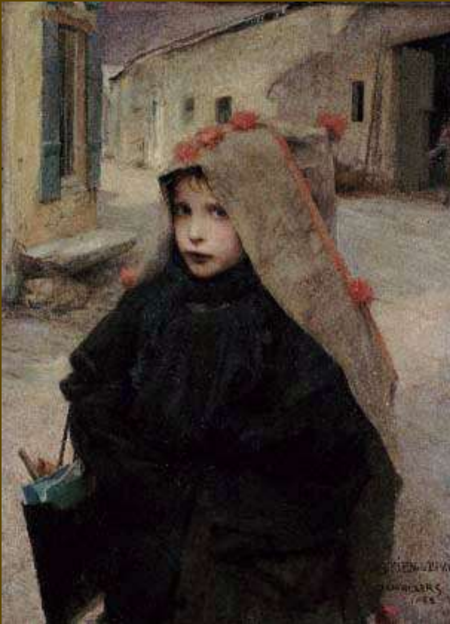
Jules Bastien Lepage, Πηγαίνοντας στο σχολείο, 1882. Aberdeen Museum and Galleries.