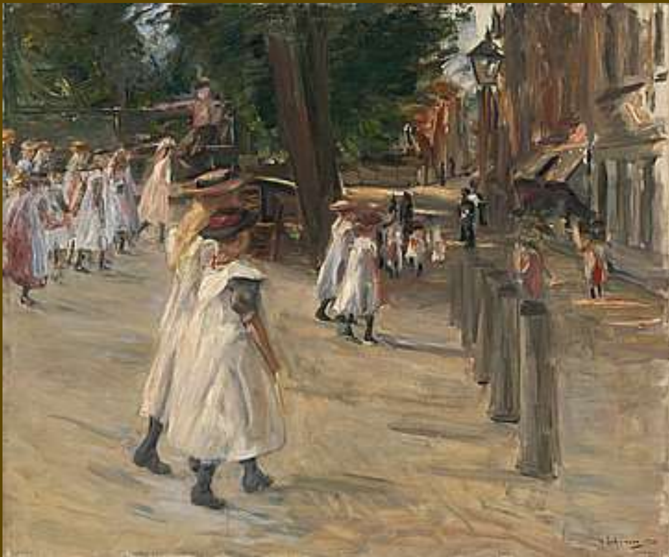
Max Liebermann, Στο δρόμο για το σχολείο στο Edam. 1904. Oscar Reinhart Museum Winterthur. Ελβετία.