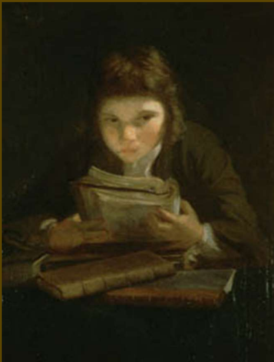
J. Reynolds, Αγόρι που διαβάζει, 1747. Ιδιωτική Συλλογή.