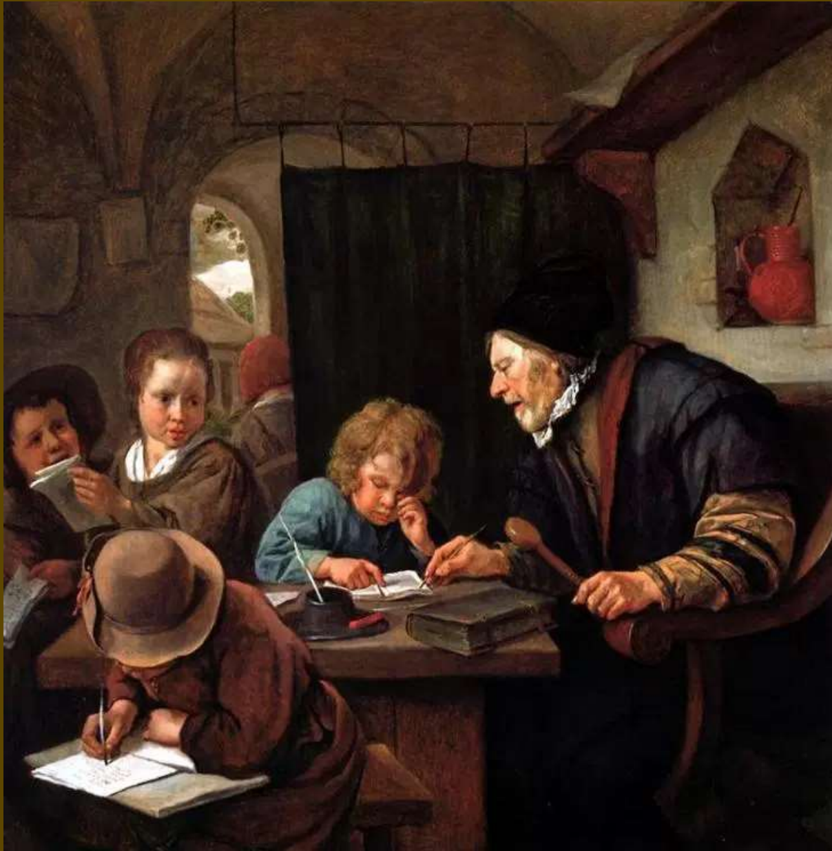
Ο δάσκαλος, Jan Steen, 1668.