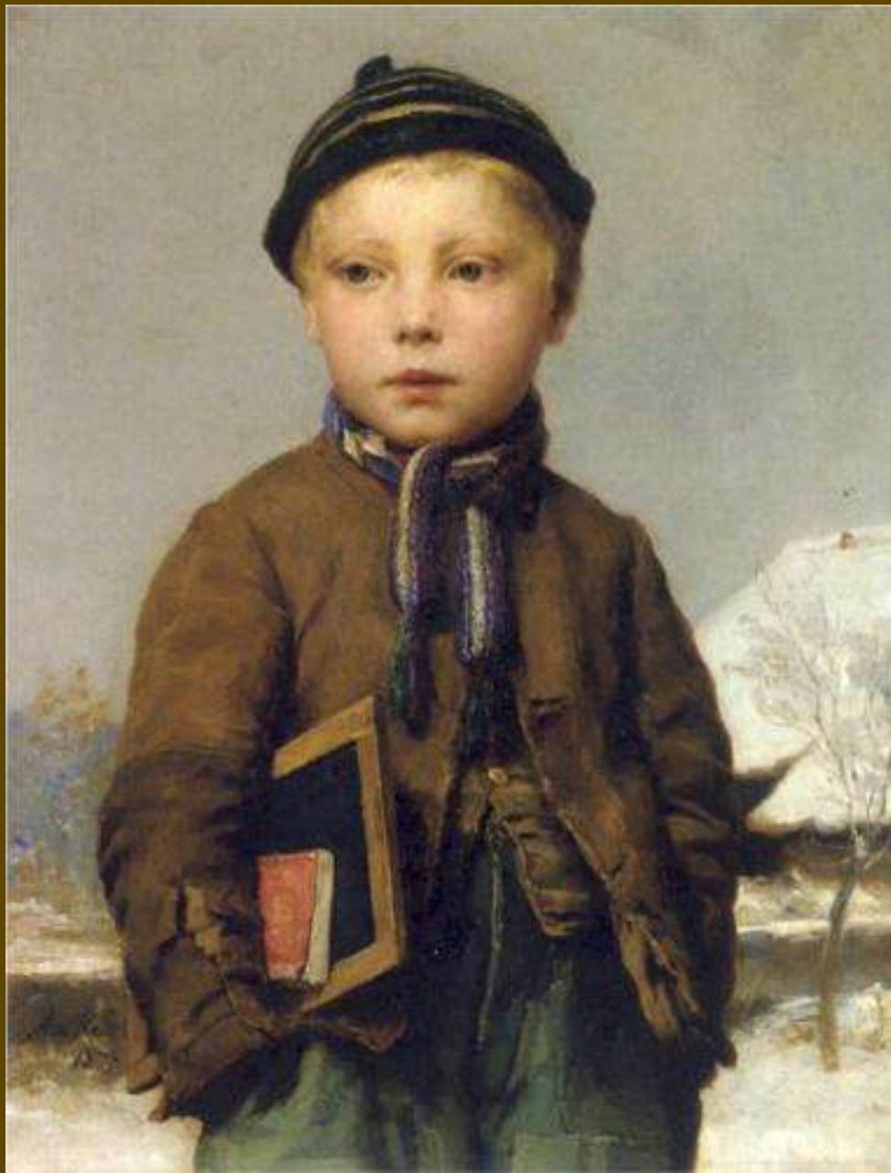
Albert Anker, μαθητής με την πλάκα του σε χιονισμένο τοπίο. 1875.