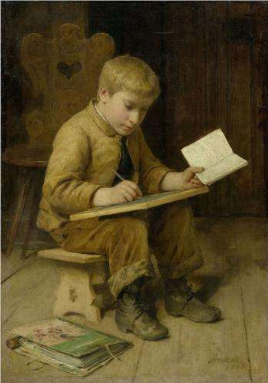
Albert Anker, αγόρι που γράφει. 1883.