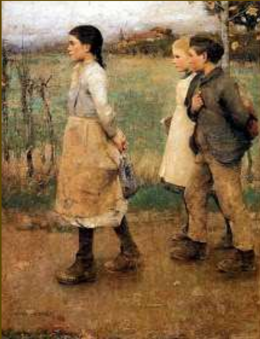
James Guthrie, Συμμαθητές, 1884. Ιδιωτική Συλλογή.