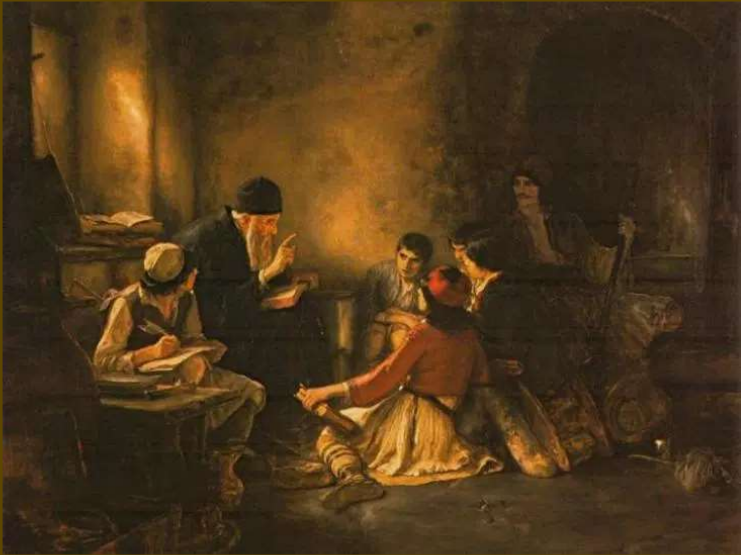
Το κρυφό σχολειό – Ν. Γύζης 1885