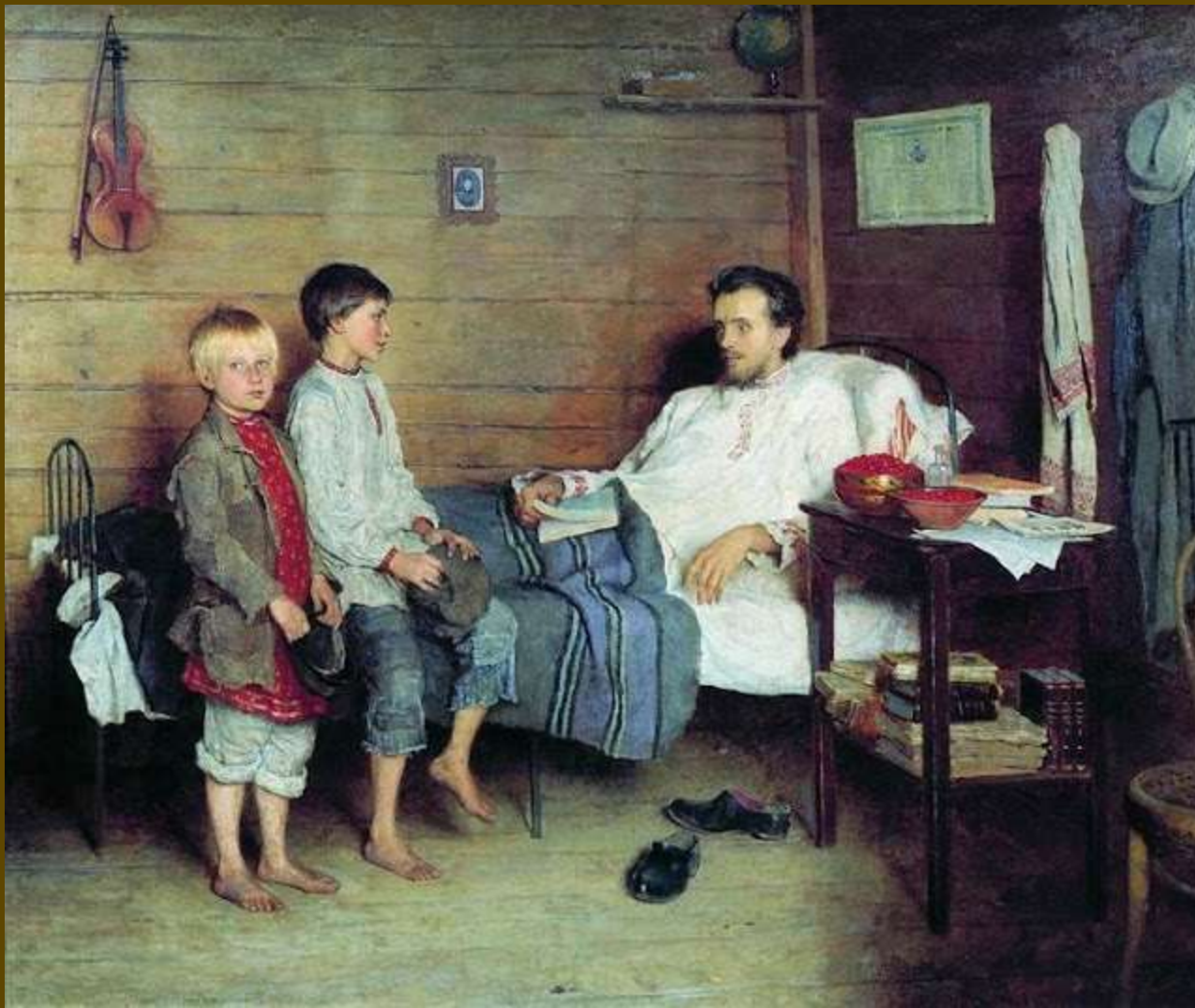
Nikolay Bogdanov-Belsky, Επίσκεψη στον άρρωστο δάσκαλο, 1897.