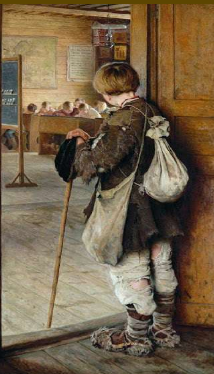
Nikolai Bogdanov- Belsky, At the School Door, 1897.