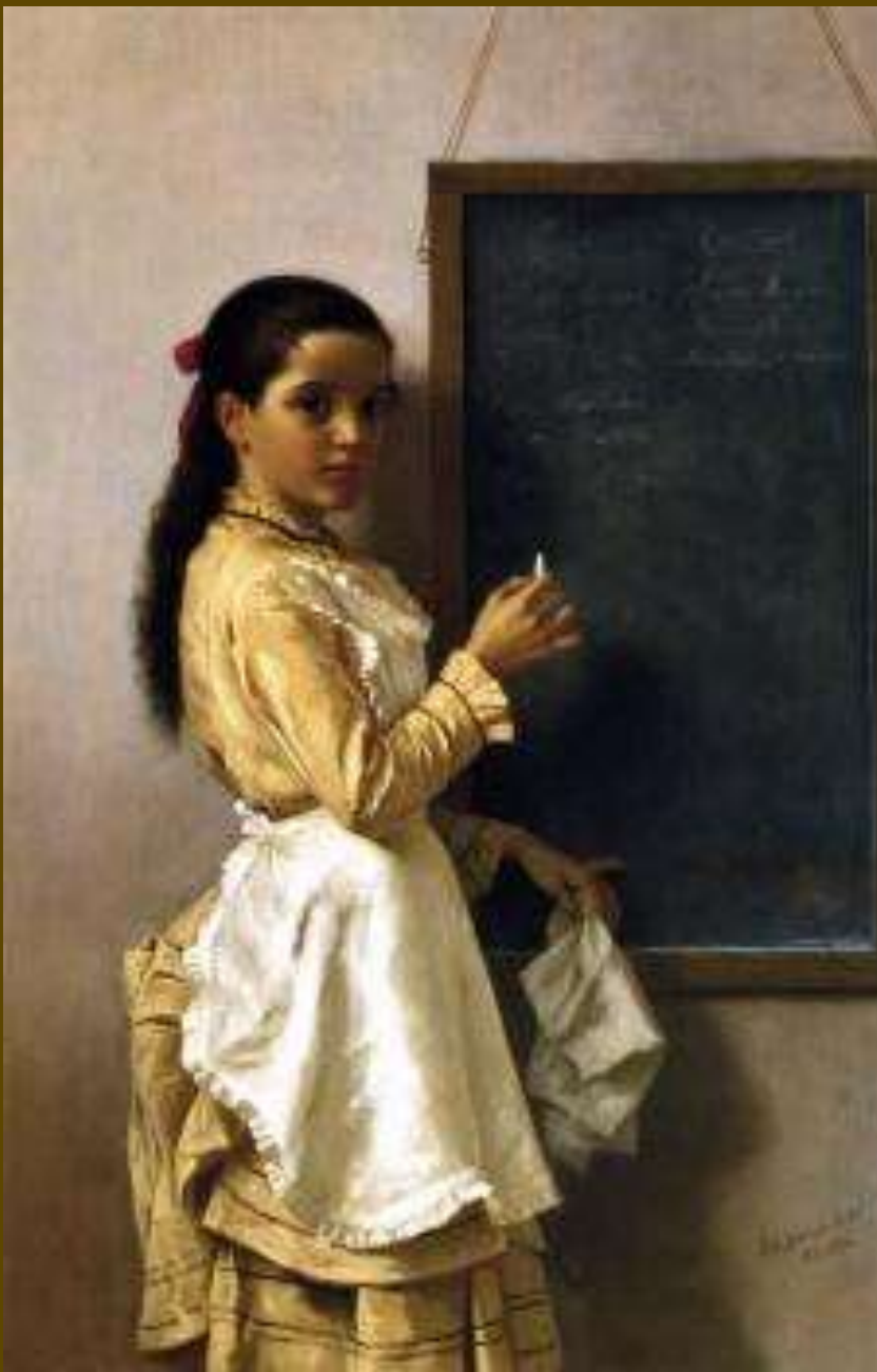
John George Brown, Ποιο είναι το όνομά σου; 1876. Ιδιωτική Συλλογή.