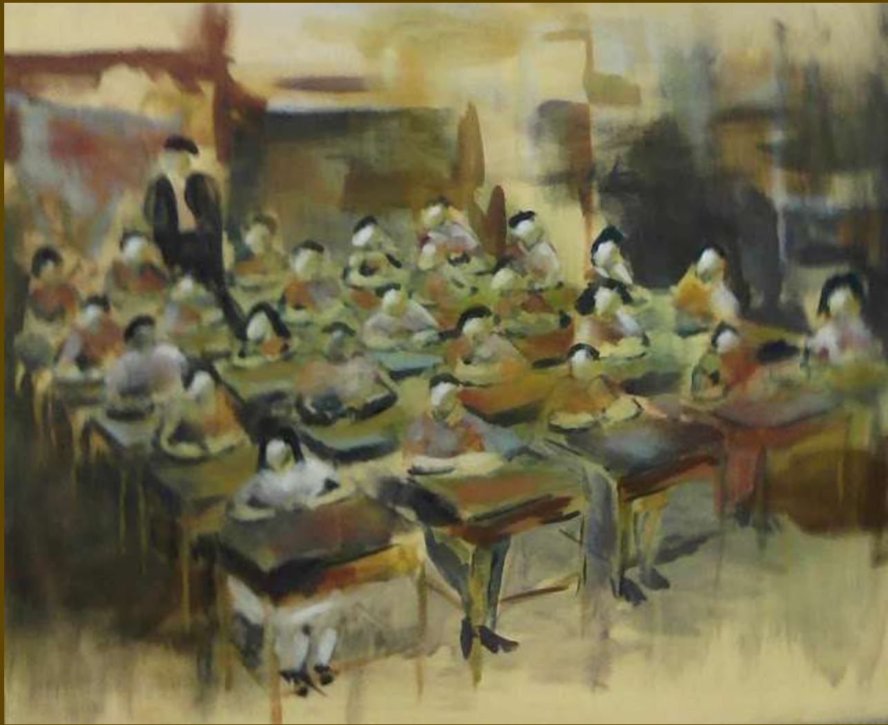
School Room by Mark Wickline.