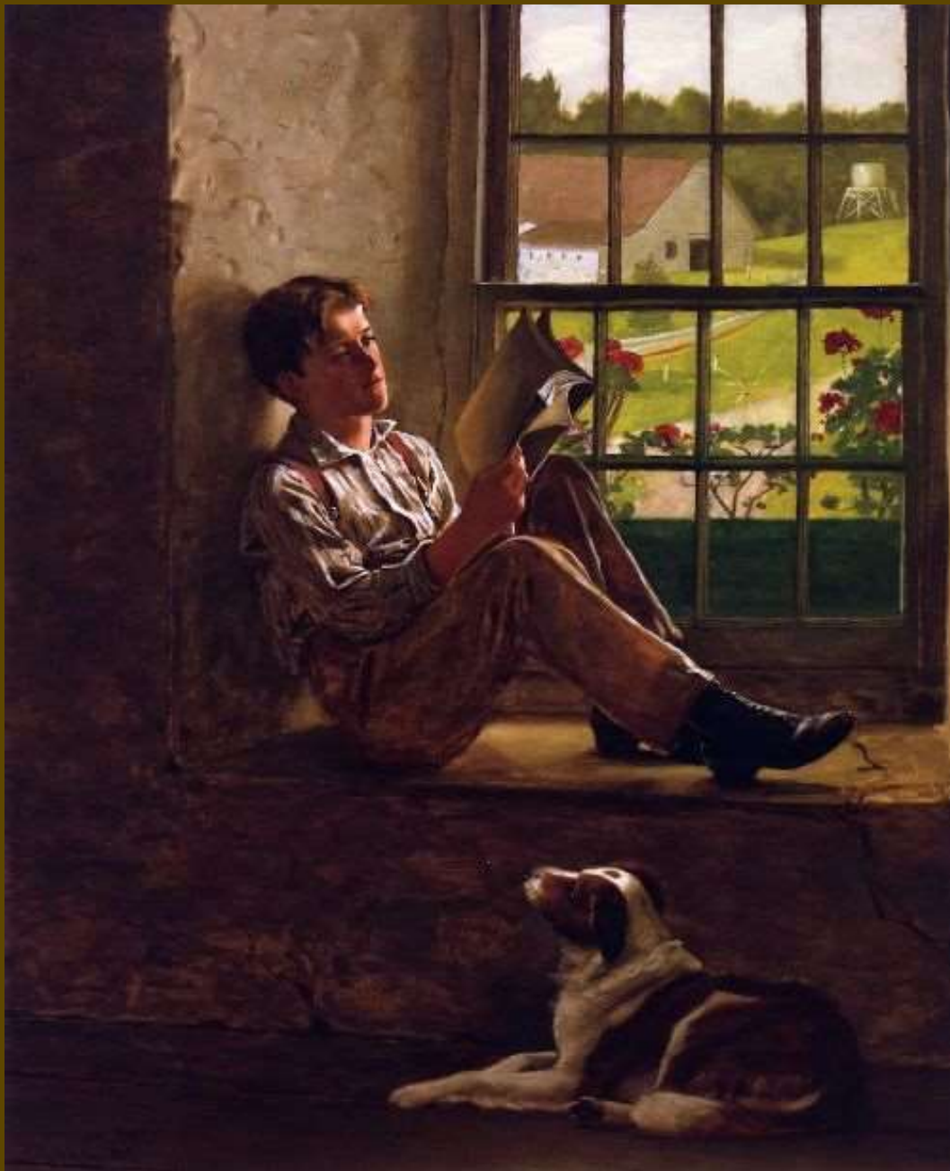
John George Brown, Ένα για μελέτη. Ιδιωτική Συλλογή.