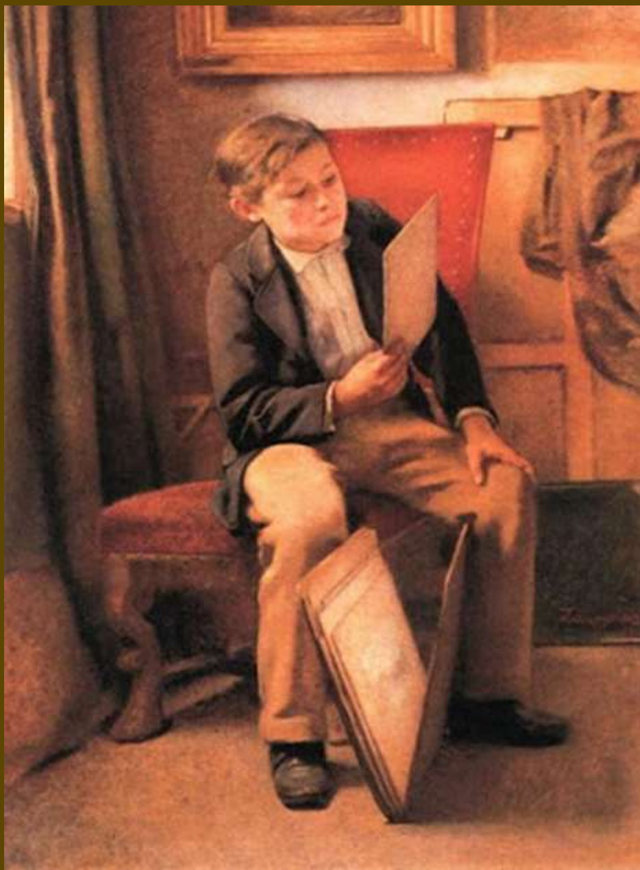
Ιωάννης Δούκας, Ο μαθητής, 1868.