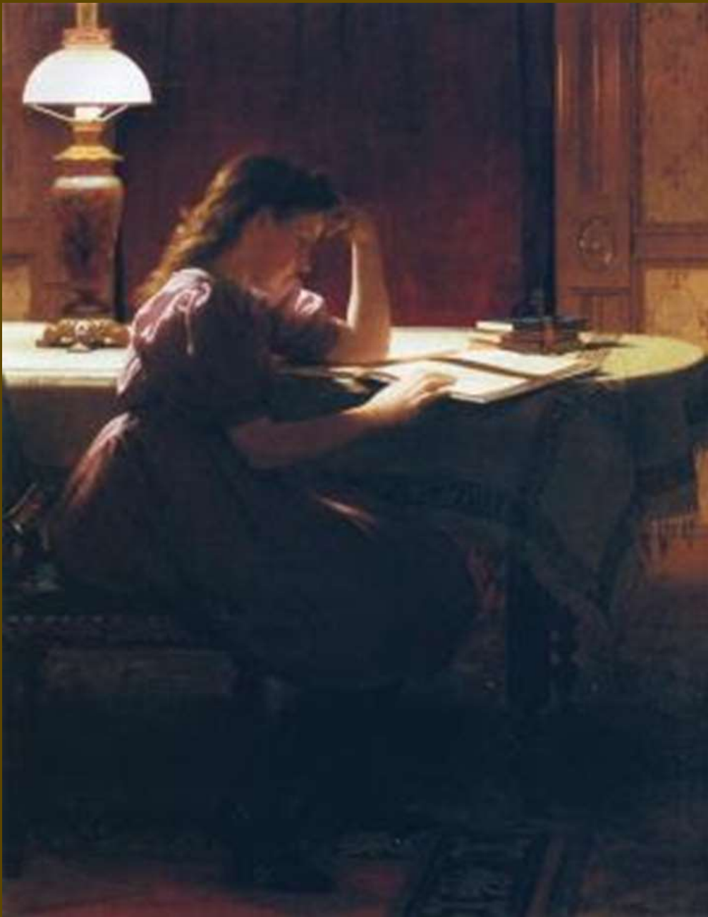
Seymour Joseph Guy, Προετοιμασία για την επόμενη ημέρα, 1895. Ιδιωτική Συλλογή.