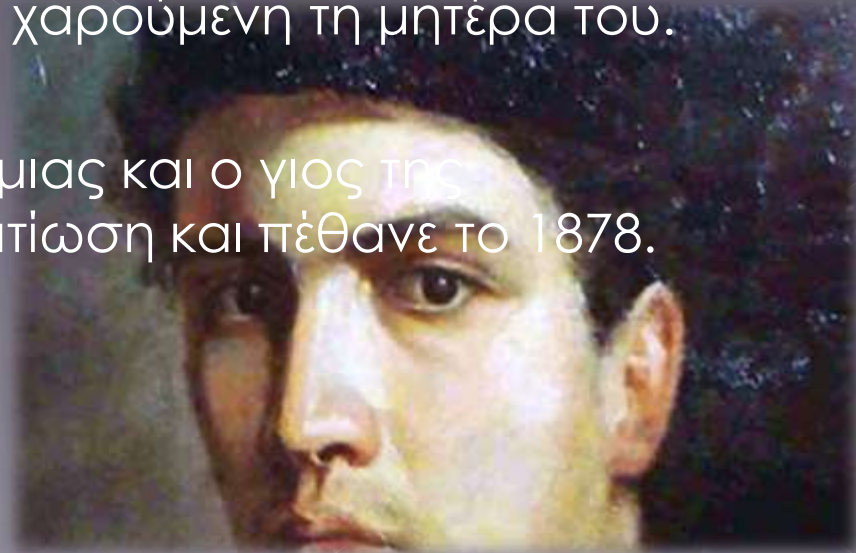
Αυτοπροσωπογραφία του Ιωάννη Αλταμούρα, 1873