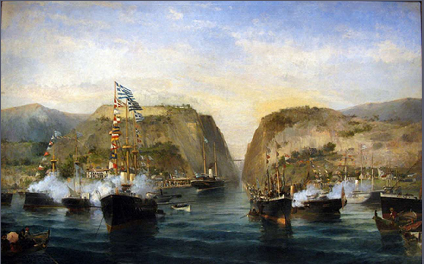
Βολανάκης, Τα εγκαίνια της διώρυγας της Κορίνθου