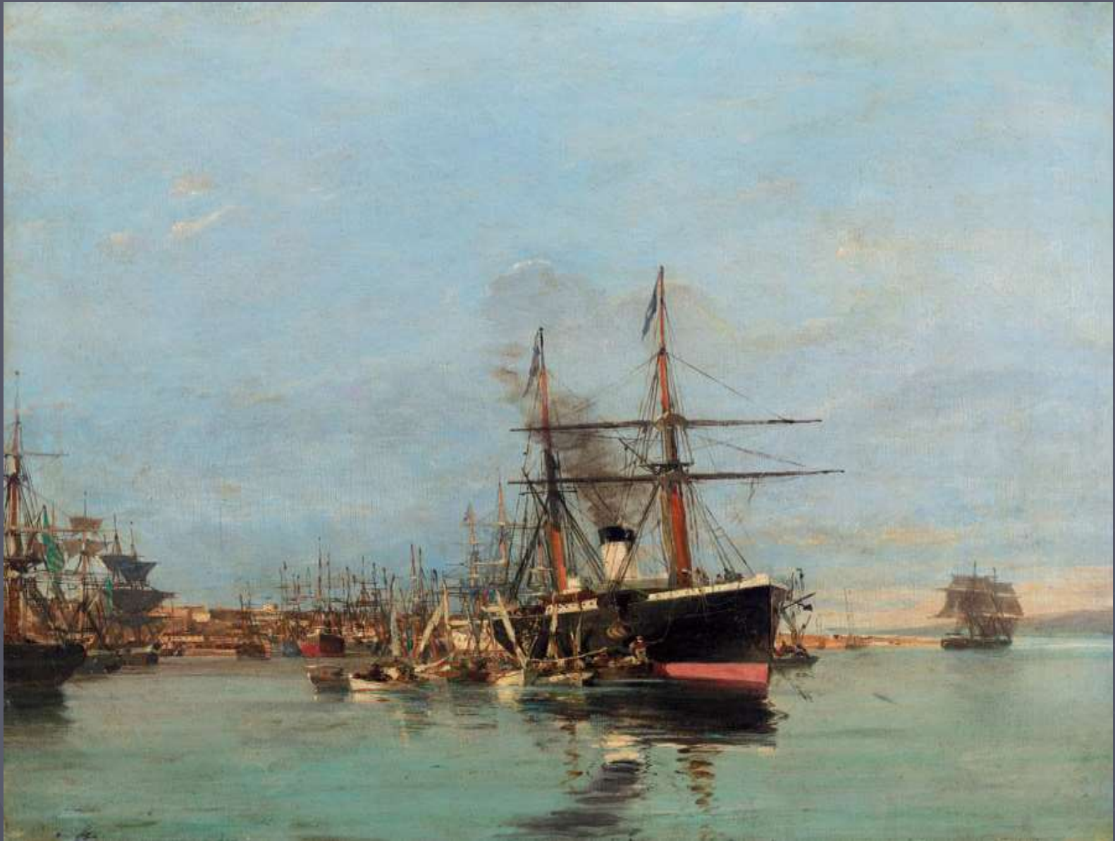
Κωνσταντίνος Βολανάκης, Το Λιμάνι του Πειραιά