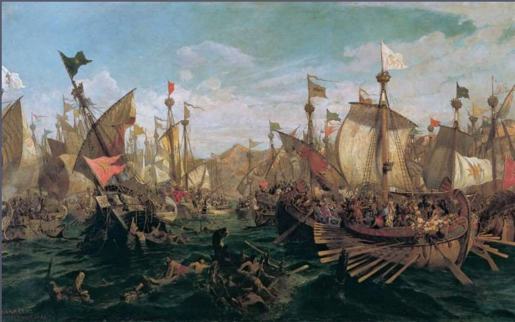
Η Ναυμαχία της Σαλαμίνας, 1882