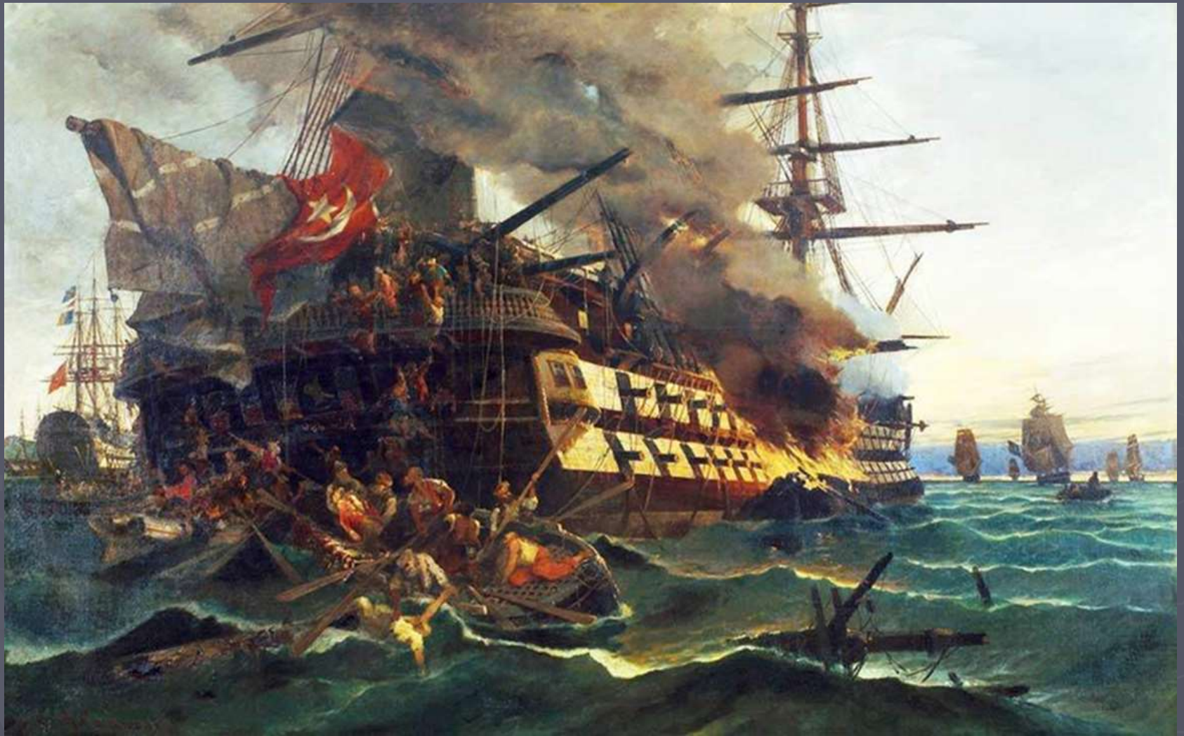
Η πυρπόληση του τουρκικού δικρότου στην Ερεσό (1882)