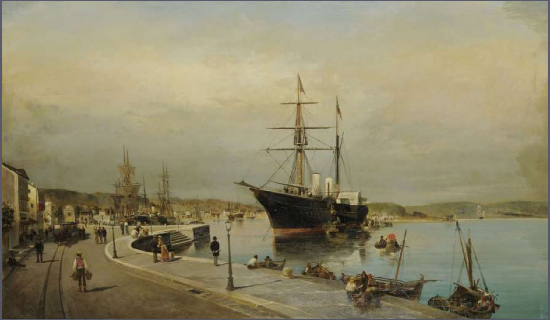
Το λιμάνι του Βόλου

Οι θαλασσογραφίες του κοσμούν τις επισημότερες αίθουσες της Αυστρίας, της Ελλάδας, ακόμη και του σταθμού του μετρό στον Πειραιά.