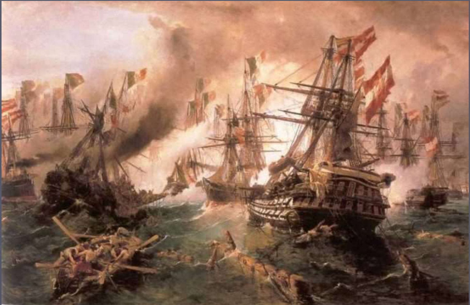
Ναυμαχία της Λίσσας (1869)

Από το 1883 μέχρι το 1903 δίδαξε στη Σχολή των Ωραίων Τεχνών της Αθήνας Στοιχειώδη Γραφή και Αγαλματογραφία.