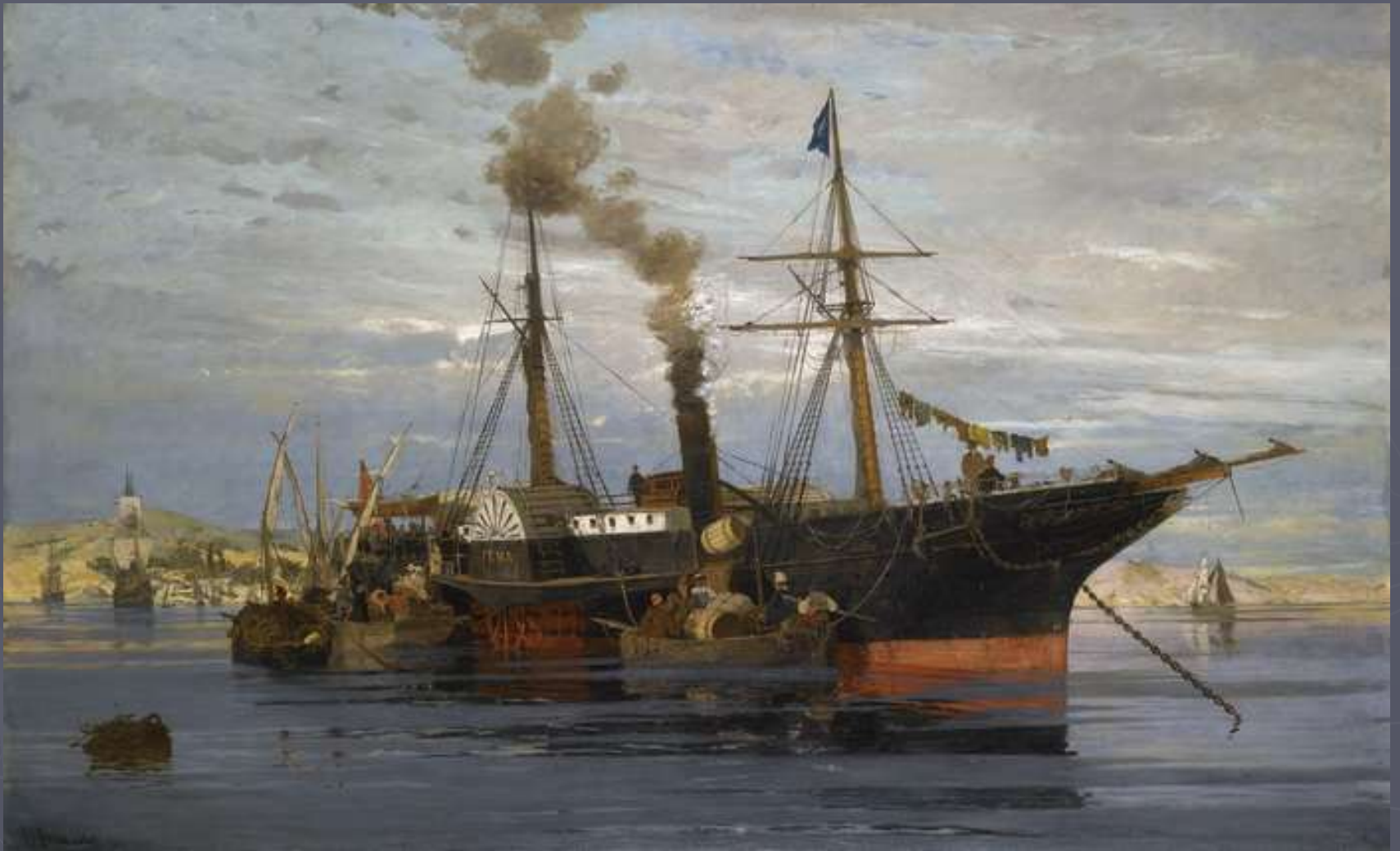
Βολανάκης, Η αναχώρηση